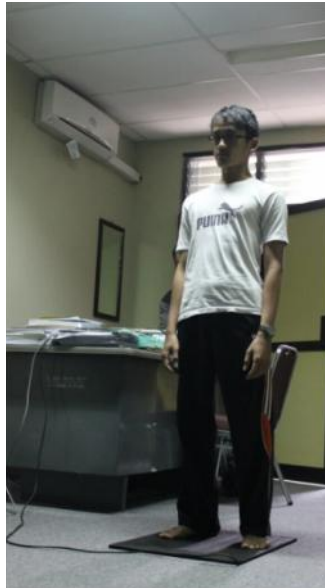
Gambar Tes kecepatan reaksi.