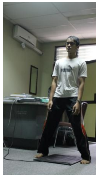
Gambar Tes kecepatan reaksi.