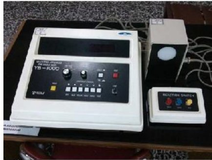
Gambar 4. Alat Test Kecepatan Reaksi