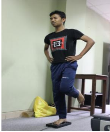
Gambar Tes keseimbangan.