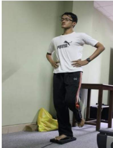
Gambar Tes keseimbangan.