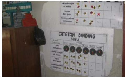
Hasil catatan kedisiplinan subyek SRL dan FJR.