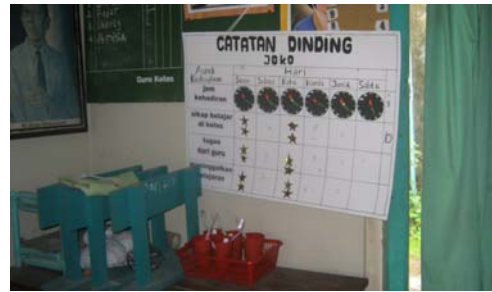
Hasil catatan kedisiplinan subyek JK.