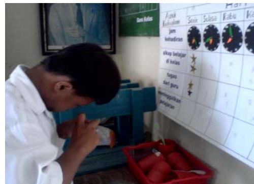
Subyek saat mengevaluasi sikap kedisiplinan belajar di kelas.