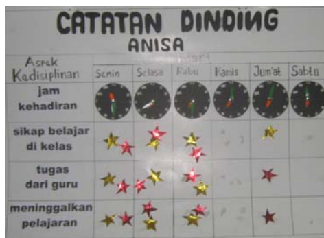
Hasil catatan kedisiplinan subyek ANS.