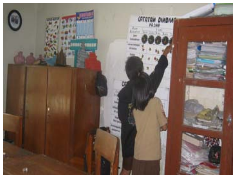
Subyek saat mengevaluasi sikap kedisiplinan bersama teman-teman.