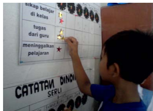
Subyek saat menempelkan bintang hasil kedisiplinan belajar di kelas.