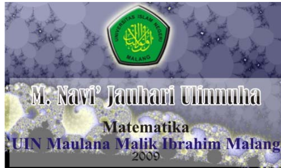
Gambar 1. Splash Screen program

Perbesaran yang bisa dilakukan oleh program ini adalah perbesaran pada semua titik kompleks yang dikehendaki. User bisa melakukan perbesaran pada titik manapun dalam screen dengan perbesaran mencapai lebih dari 10 triliyun perbesaran.