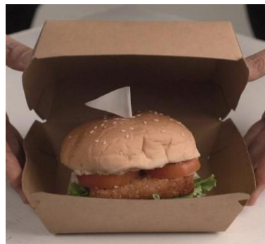
Gambar 1. Pengemasan Burger

kemasan yang tidak dibuang ( Semi Disposable ). Wadah-wadah ini biasanya digunakan untuk kepentingan lain di rumah konsumen setelah dipakai dan digunakan untuk penyimpanan bahan makanan atau jenis makanan yang lain. Sucipta (2017: 26) Menjelaskan bahwa terdapat pengemasan tradisional dan pengemasan modern. Terdapat berbagai bentuk dan variasi dalam pengemasan suatu produk. Dalam pengemasan pada produk beef burger yang identik dengan makanan modern maka pengemasan yang digunakanpun harus sesuai dengan produknya. Penelitian ini akan menggunakan kemasan modern yang sederhana dengan berbentuk kotak berbahan dasar kertas dan bersifat Disposable sesuai dengan gambar berikut ini.