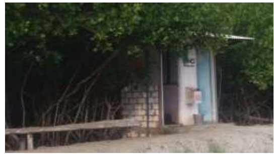
Gambar 3. Toilet kawasan ekowisata