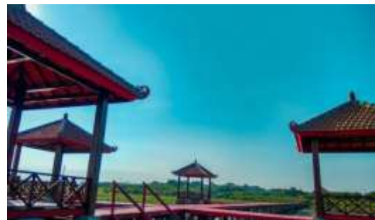
Gambar 5. Gazebo hutan mangrove