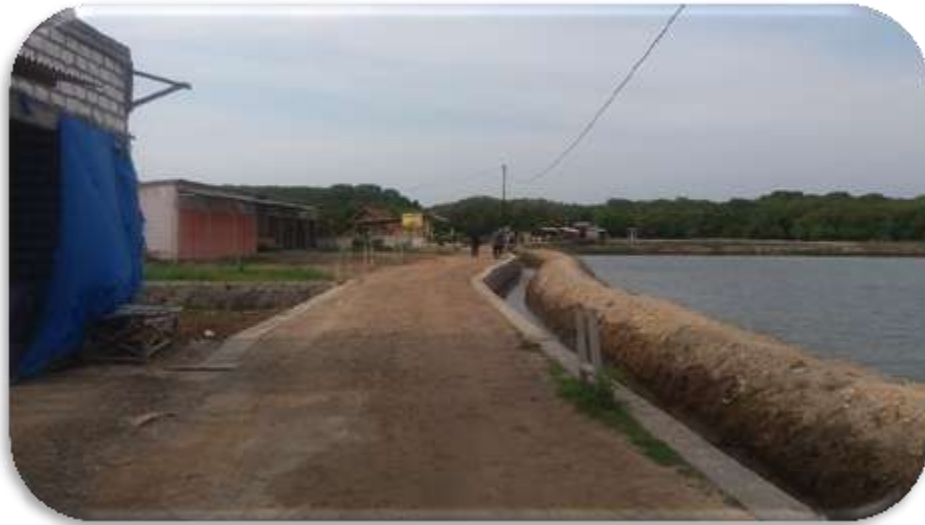
Gambar 6. Kondisi jalan menuju kawasan hutan mangrove

Sarana pelayanan loket di kawasan ini belum ada, karena pengunjung yang datang ke hutan mangrove tidak dipungut biaya, hanya dikenakan biaya parkir sebesar Rp 2000,00 untuk sepeda motor dan Rp 4000,00 untuk mobil. Kondisi jalan menuju lokasi masih menggunakan perkerasan makadam.