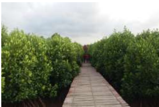
Gambar 2. Jembatan merah

Hutan mangrove Desa Pasar Banggi saat ini telah dibuka menjadi area wisata dengan fasilitas yang sederhana karena masih berada pada konsep pengembangan perencanaan yang dikelola oleh pihak masyarakat setempat. Beberapa fasilitas rekreasi eksisting hutan mangrove antara lain, area lahan parkir, area pembibitan, lahan serta bibit konservasi mangrove, jembatan kayu sebagai sarana pejalan kaki, gazebo, dan gapura pintu masuk kawasan mangrove.