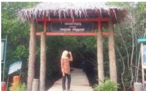
Gambar 4. Gapura masuk hutan mangrove