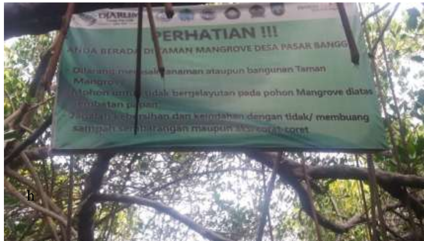
Gambar 8. Peraturan yang harus ditaati di kawasan hutan mangrove

Priono (2012: 52) bahwa, pengelola harus memiliki kepedulian, tanggung jawab, serta komitmen terhadap pelestarian lingkungan alam dan memperhatikan perilaku ekologis dan melaksanakan kaidah-kaidah usaha yang bertanggung jawab untuk kemajuan masyarakat sekitar.