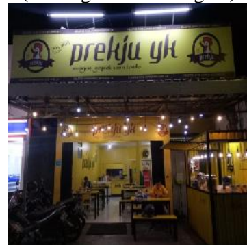
(Cabang Kusuma Negara)