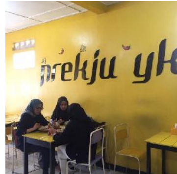
(Cabang Kusuma Negara)