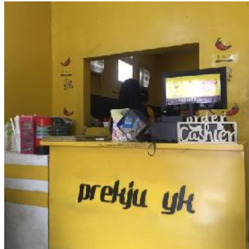
(Cabang Kusuma Negara)