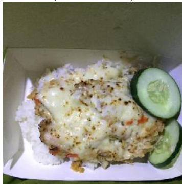
(Ayam Geprek Karella)