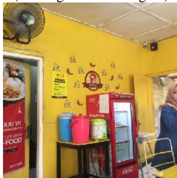
(Cabang Kusuma Negara)