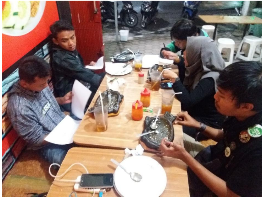
Gambar 1.3 Responden mengisi kuesioner