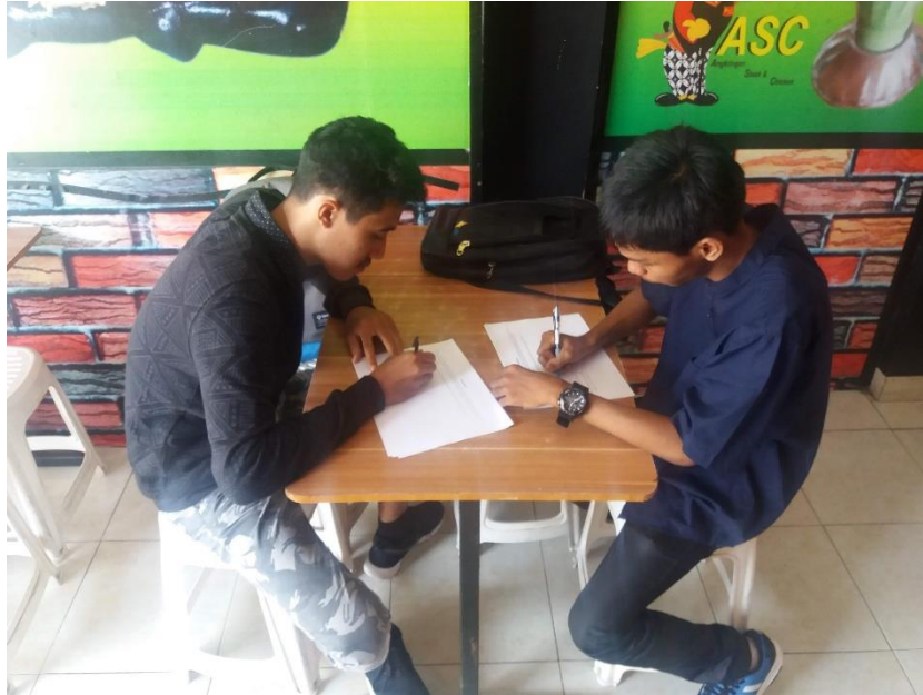
Gambar 1.1 Responden mengisi kuesioner