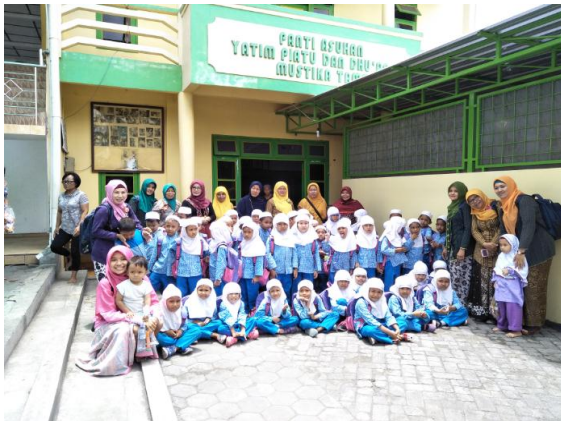
Kunjungan ke Panti Asuhan