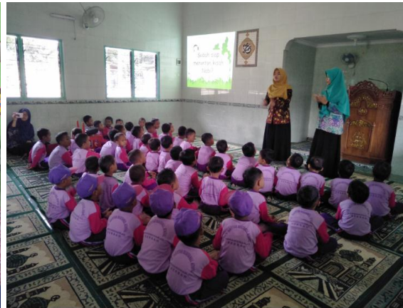
Nonton film edukatif