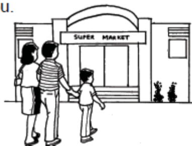
Gambar 2. 5 Keluarga Didi pergi ke supermarket