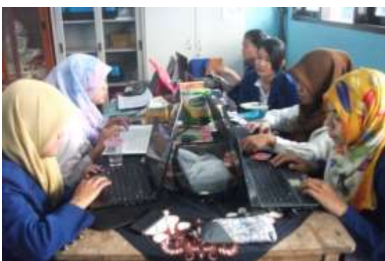
Gambar 15. Membantu administrasi Guru