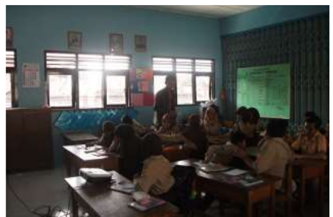
Gambar 24. Praktik mengajar I kelas VI