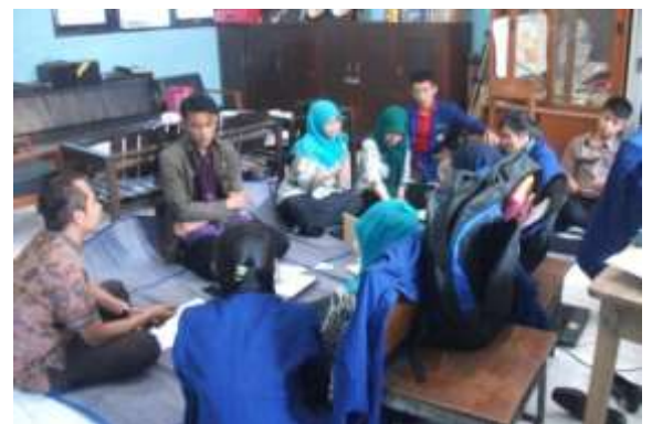
Gambar 14. Koordinasi dengan koordinator DPL