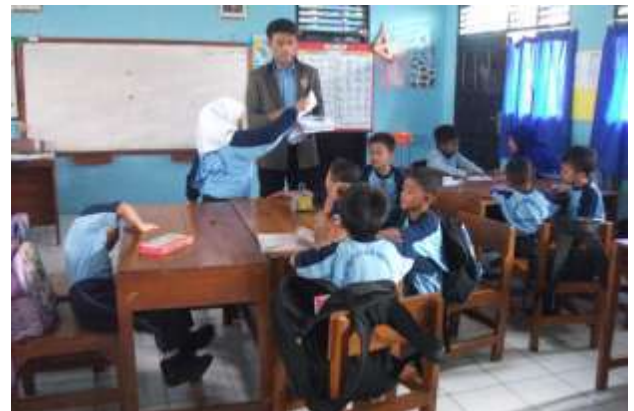
Gambar 22. Praktik mengajar III kelas II (Ujian)