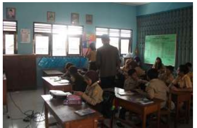
Gambar 28. Praktik mengajar III kelas VI (Ujian)