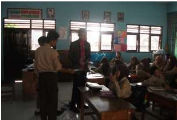
Gambar 27. Praktik mengajar III kelas VI (Ujian)