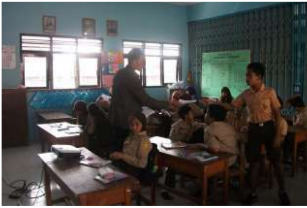
Gambar 25. Praktik mengajar II kelas VI