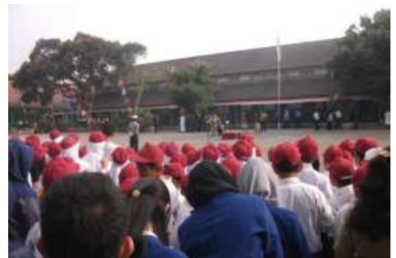
Gambar 12. Upacara HUT ke 70 RI