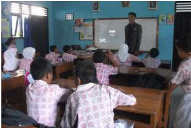
Gambar 17. Praktik mengajar I kelas II