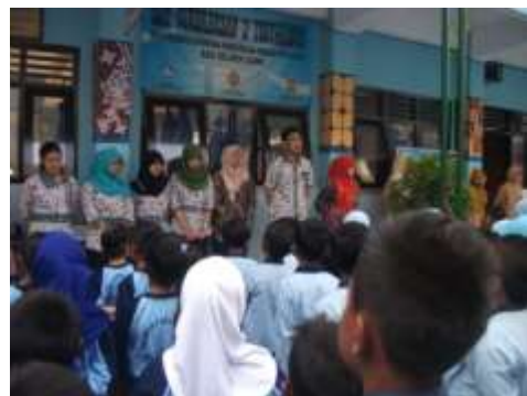
Gambar 4. Penarikan PPL