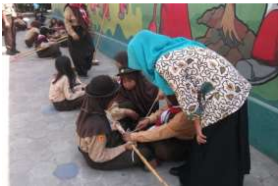
Gambar 3. Latihan Pramuka