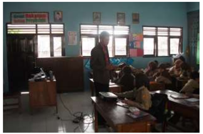
Gambar 26. Praktik mengajar II kelas VI