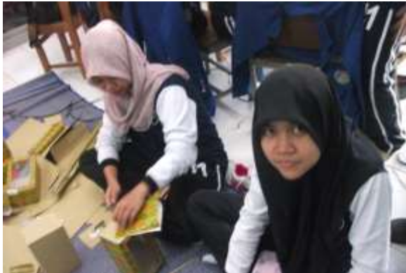
Gambar 1. Membuat Kotak Saran