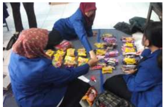
Gambar 6. Persiapan Lomba HUT RI