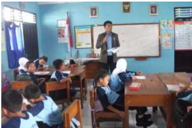
Gambar 21. Praktik mengajar III kelas II (Ujian)