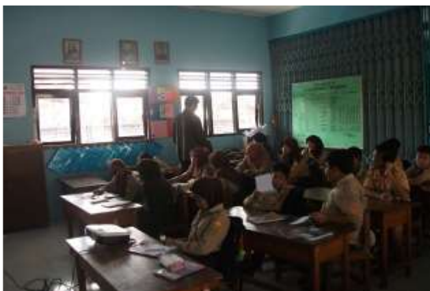
Gambar 23. Praktik mengajar I kelas VI