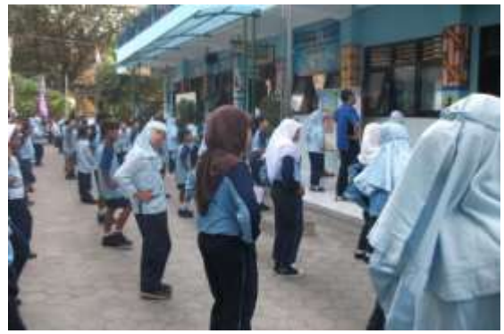
Gambar 10. Senam Pagi