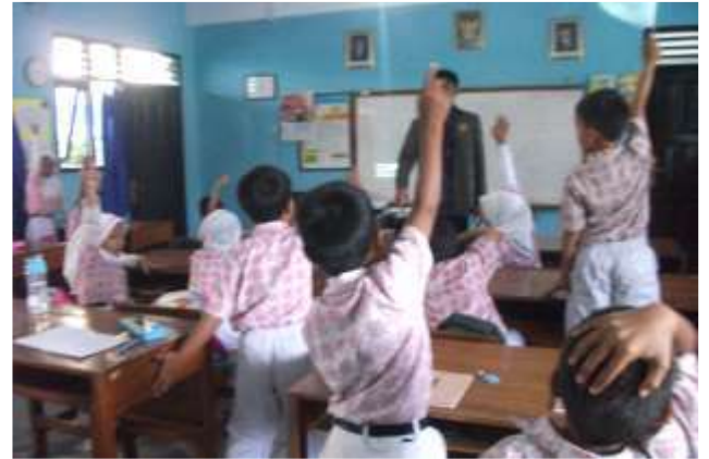
Gambar 18. Praktik mengajar I kelas II