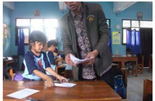
Gambar 20. Praktik mengajar II kelas II