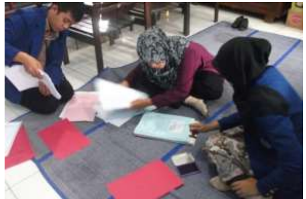
Gambar 2. Pemilahan Dokumen