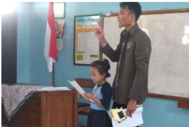
Gambar 19. Praktik mengajar II kelas II