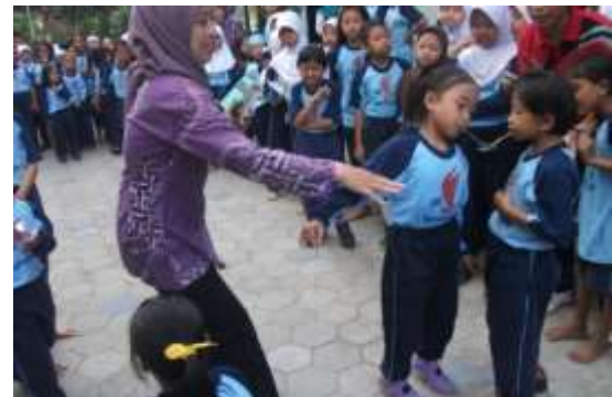
Gambar 8. Lomba HUT ke -70 RI