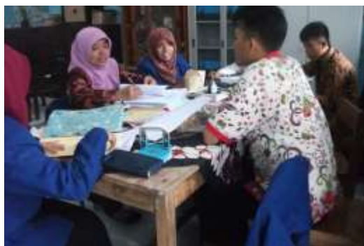
Gambar 5. Kunjungan DPL