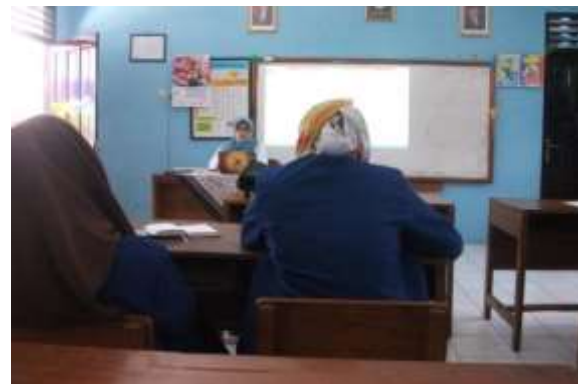
Gambar 13. Rapat bersama guru