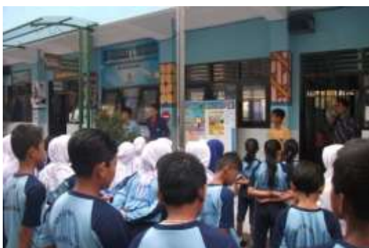
Gambar 7. Apel Pagi