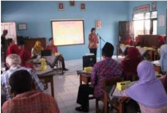
Gambar 11. Syawalan dan Sosialisasi RKAS