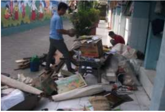
Gambar 9. Kerja Bakti