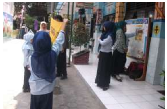
Gambar 16. Latihan Upacara Bendera