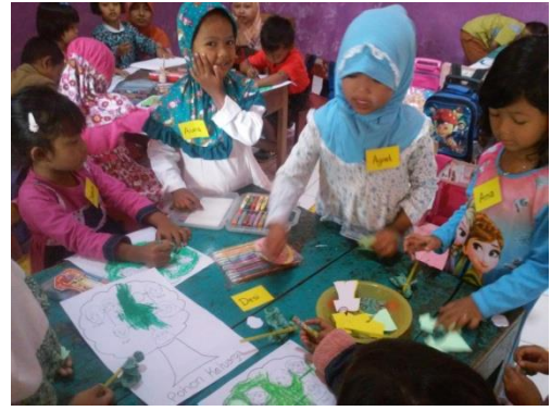
Praktik Pembelajaran di dalam kelas