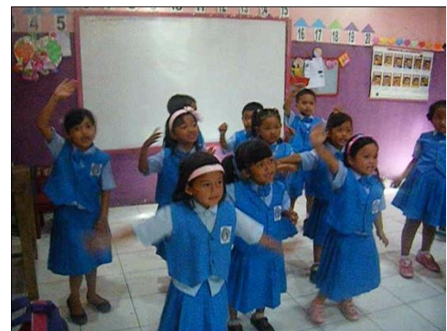
Pelatihan Gerak dan Lagu