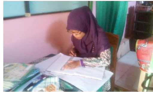
Pengerjaan Administrasi Kelas