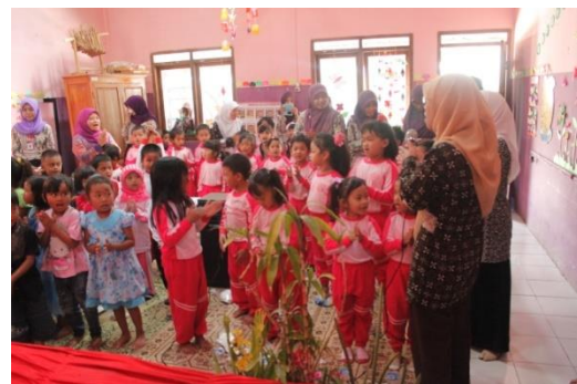
Pentas Perpisahan PPL