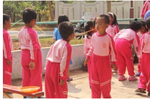
Lomba HUT RI ke-70