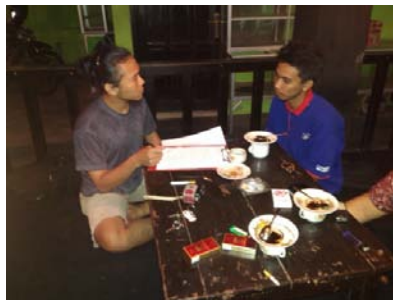
Gambar 18. Foto peneliti bersama masyarakat yang juga menjadi anggota komunitas motor lain.