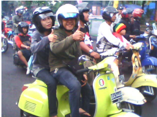
Gambar 3. Foto saat acara Rally Gembira pada saat acara ulang tahun STANG yang dilaksanakan di Alun-alun Kota Nganjuk. Diambil pada 2 April 2011