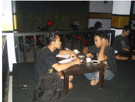
Gambar 14. Foto peneliti bersama anggota STANG.