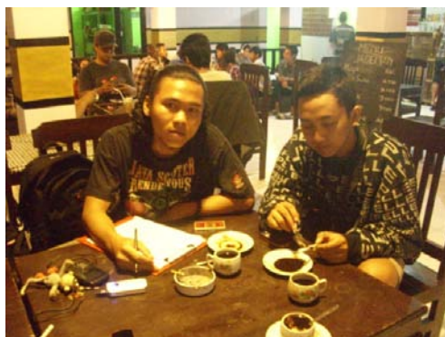
Gambar 16. Foto peneliti bersama masyarakat yang juga menjadi anggota komunitas motor lain.