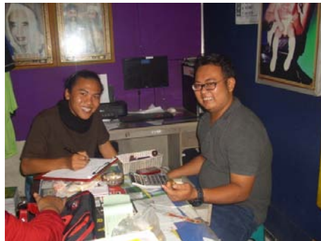
Gambar 15. Foto peneliti bersama masyarakat yang juga menjadi anggota komunitas motor lain.