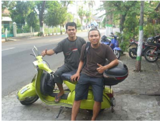
Gambar 11. Foto peneliti bersama sekretaris STANG. Diambil pada 24 Desember 2013