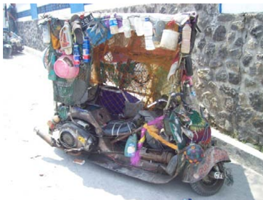
Gambar 7. Contoh aliran skuter rosok sampah Diambil pada 30 September 2011