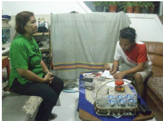
Gambar 9. Foto peneliti bersama bendahara STANG.