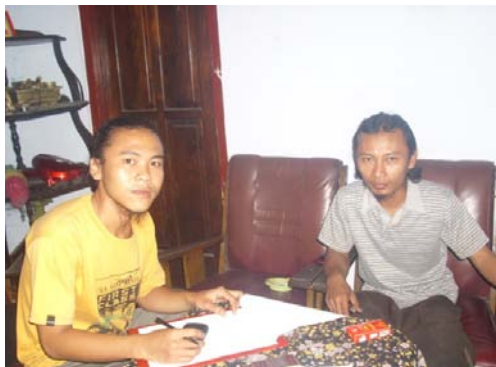
Gambar 10. Foto peneliti bersama wakil sekretaris STANG.