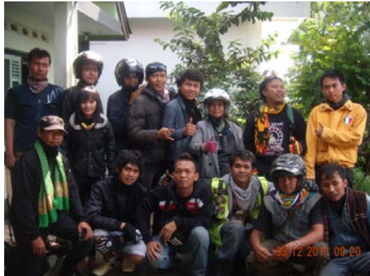
Gambar 2. Foto peneliti bersama Ciamis Independent Scooter (CIS) saat akan berangkat menuju lokasi JSR Bandung. Diambil pada 3 Desember 2011