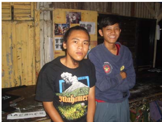
Gambar 13. Foto peneliti bersama anggota STANG. Diambil pada 24 Desember 2013