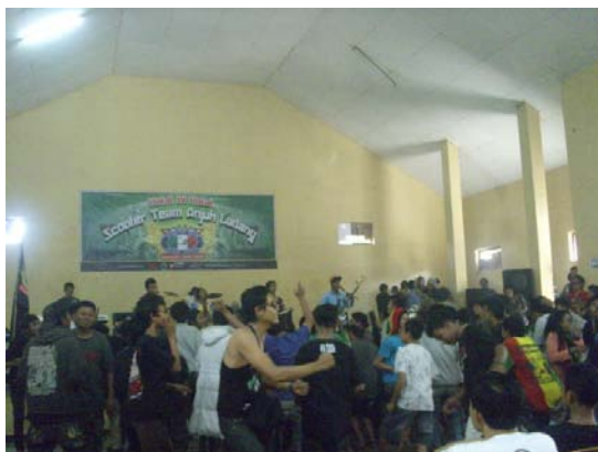
Gambar 4. Foto pada saat acara Halal bihalal STANG di desa Berbek. Diambil pada 14 Agustus 2013