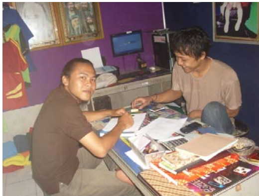
Gambar 12. Foto peneliti bersama anggota STANG. Diambil pada 18 Agustus 2013