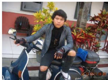
Gambar 19. Foto peneliti bersama skuternya.