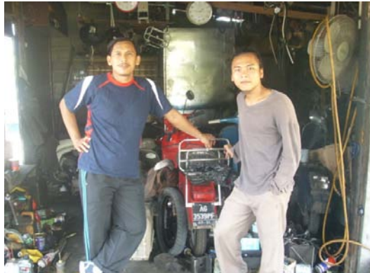
Gambar 8. Foto peneliti bersama ketua STANG