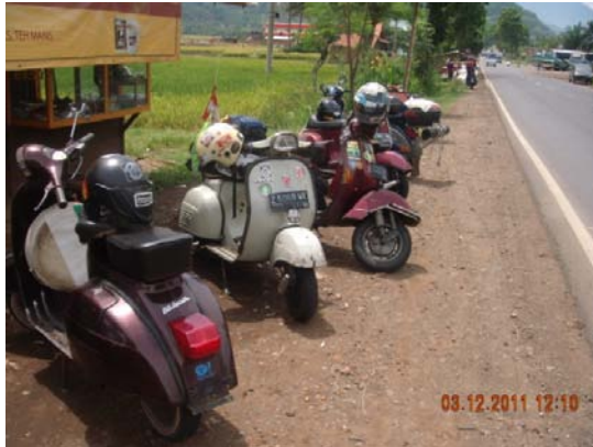
Gambar 5. Contoh aliran skuter standar Diambil pada 3 Desember 2011