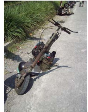
Gambar 6. Contoh aliran skuter extreme Diambil pada 30 September 2011