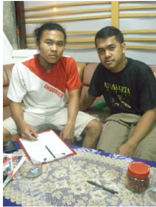
Gambar 17. Foto peneliti bersama masyarakat yang juga menjadi anggota komunitas motor lain.