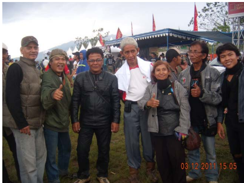
Gambar 1. Foto peneliti bersama Petualang Orang Tua Gila Scooter (PORTUGIS) saat menghadiri acara JSR di lapangan Kiarapayung, Bandung.