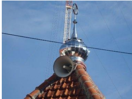
Gambar 30. Pengeras Suara di Masjid sebagai Salahsatu Contoh EWS