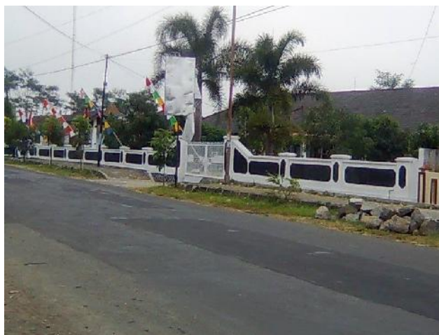
Gambar 34. Jalur Evakuasi Tanpa Adanya Petunjuk Evakuasi

Proses evakuasi akan berjalan lebih optimal jika setiap jalur evakuasi memiliki papan petunjuk arah evakuasi. Keberadaan petunjuk jalur evakuasi akan lebih memudahkan penduduk melauaka evakuasi. Pada saat terjadi bencana erupsi gunungapi sebagian besar penduduk akan mengalami kepanikan saat melakukan upaya penyelamatan diri. Akibatnya sering terjadi adanya penduduk yang berupaya menyelamatkan diri, namun menuju kearah yang sala. Kondisi ini akan meningkatkan risiko akibat bencana erupsi gunungapi. Keberadaan petunjuk evakuasi akan meningkatkan kapasitas wilayah dalam menghadapi bencana.