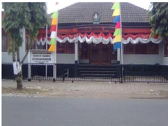
Gambar 36. Balai desa sebagai Salahsatu Contoh Lokasi Evakuasi