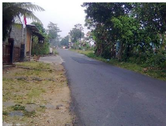
Gambar 32. Jalur Evakuasi pada Saat Terjadi Bencana