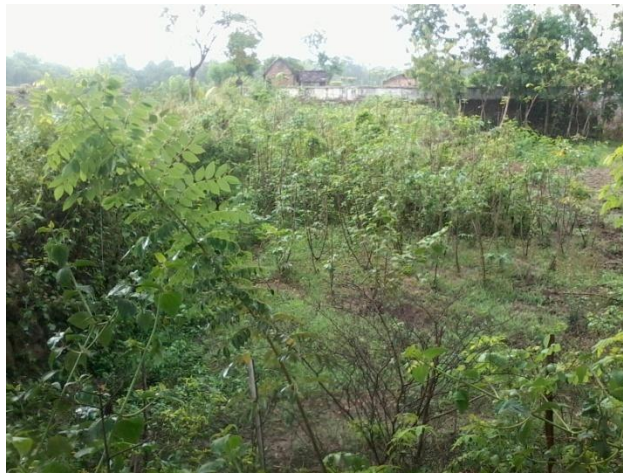
Gambar 9.LahanBekasGalianBatu Bata Sudahditanami