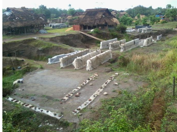
Gambar 9.LahanBekasGalianBatu Bata Belumditanami