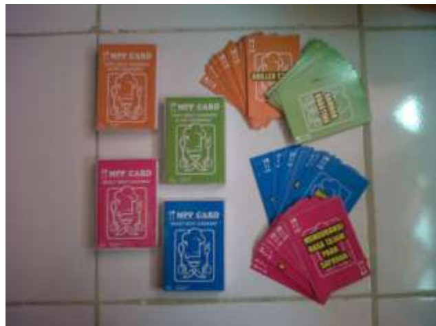
Gambar 1. Kartu Pertanyaan dan Jawaban Penerapan Make A Match