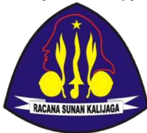
Gambar 1. Bentuk Lambang Racana UIN Sunan kalijaga Yogyakarta