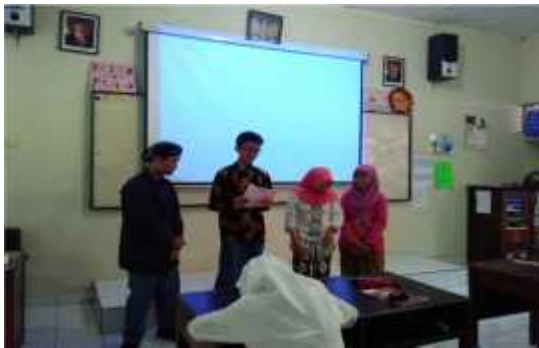
Siswa presentasi hasil diskusi kelompok