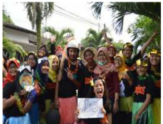
Karnaval Ulang Tahun Sekolah