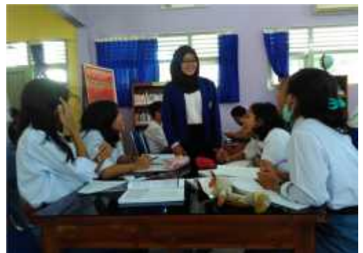
Pembelajaran di Perpustakaan