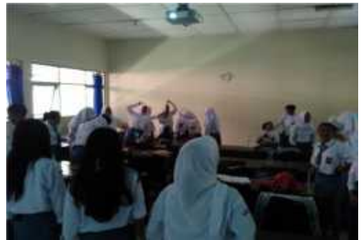
Siswa mengikuti kuis dan games