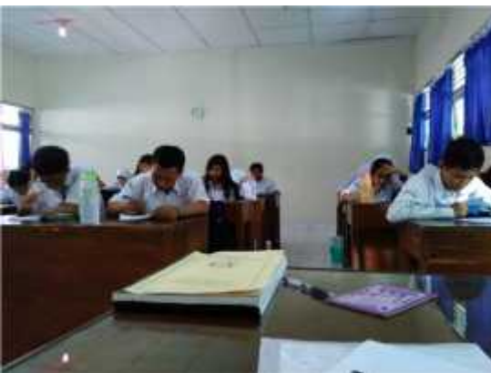
Siswa Mengerjakan Soal Ulangan Harian