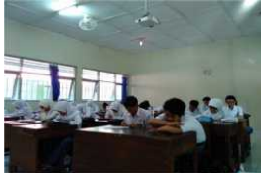
Siswa mengerjakan LKS