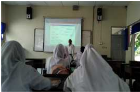
Observasi Kelas X IPA 4