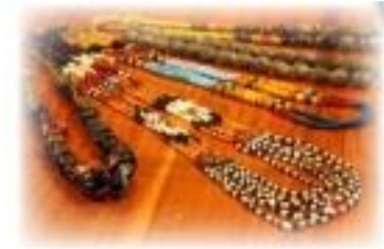
kerajinan dari sulawesi

Melempar bola dilakukan dengan menggunakan tangan yang terkuat. Genggam bola dengan kuat, pandangan fokus ke arah yang dituju. Ambil ancang-ancang dengan menarik tangan yang membawa bola ke belakang lalu ayunkan ke depan. Gerakan ini disertai dengan tarikan dan ayunan kaki.