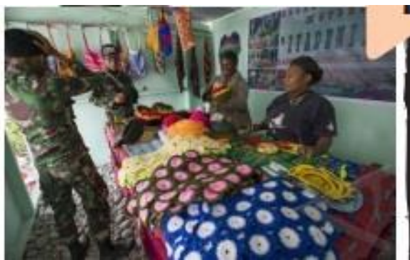
kerajinan dari papua