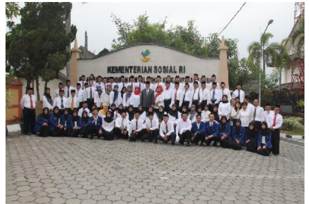
Doc. Foto bersama Pegawai BBPPKS Yogyakarta