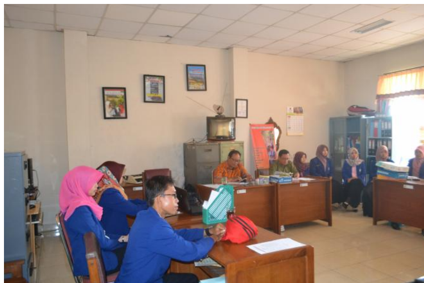
Doc. Diskusi Rutin bersama TIM Lab. Peksos