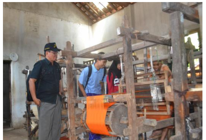
Doc. Kegiatan Identifikasi dan analisis kebutuhan di desa Gamplong