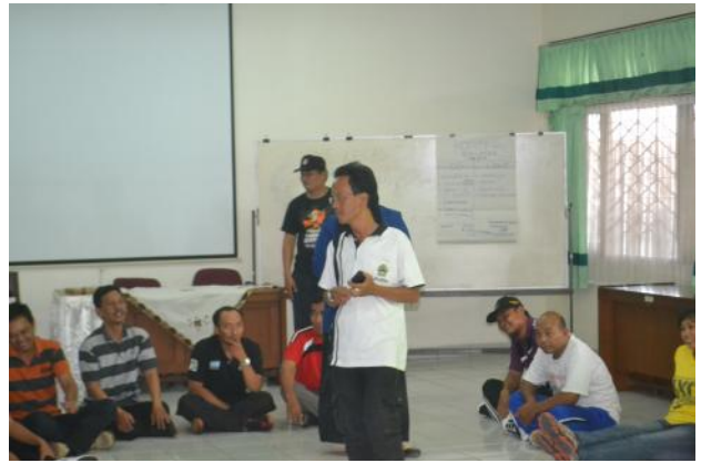
Doc. Latihan persiapan dan kegiatan Dinamika Kelompok KUBE Angkatan I dan II