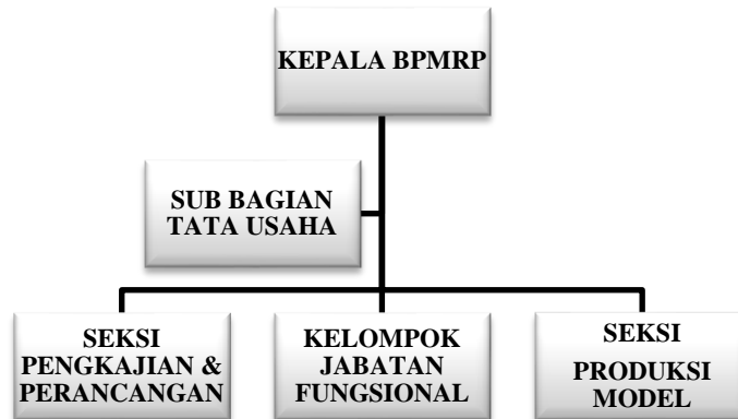
Gambar 1. Struktur Organisasi BPMRP