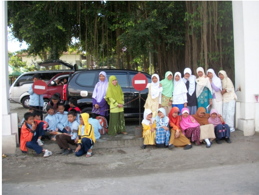
Doc. Kunjungan Edukatif