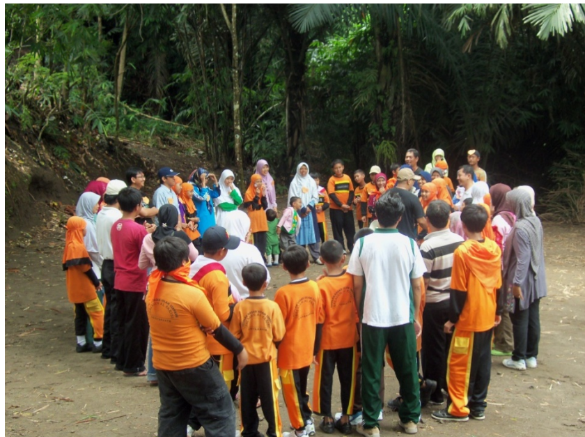
Doc. Family Gathering