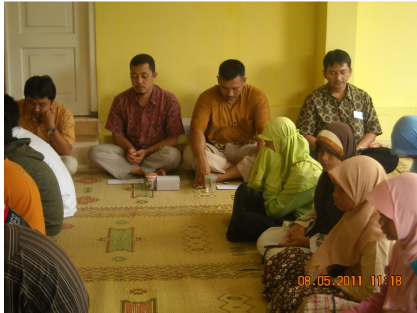
Doc. Rapat komite kelas V