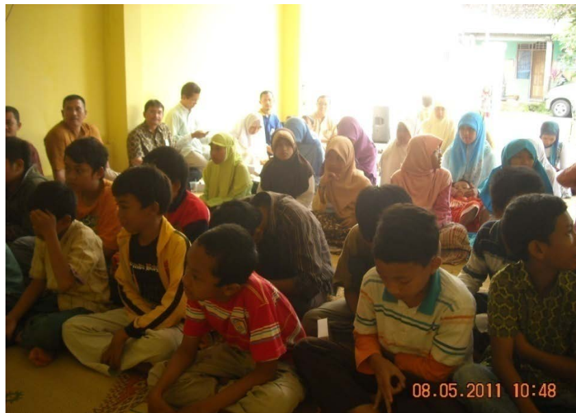
Doc. Mabit Motivasi