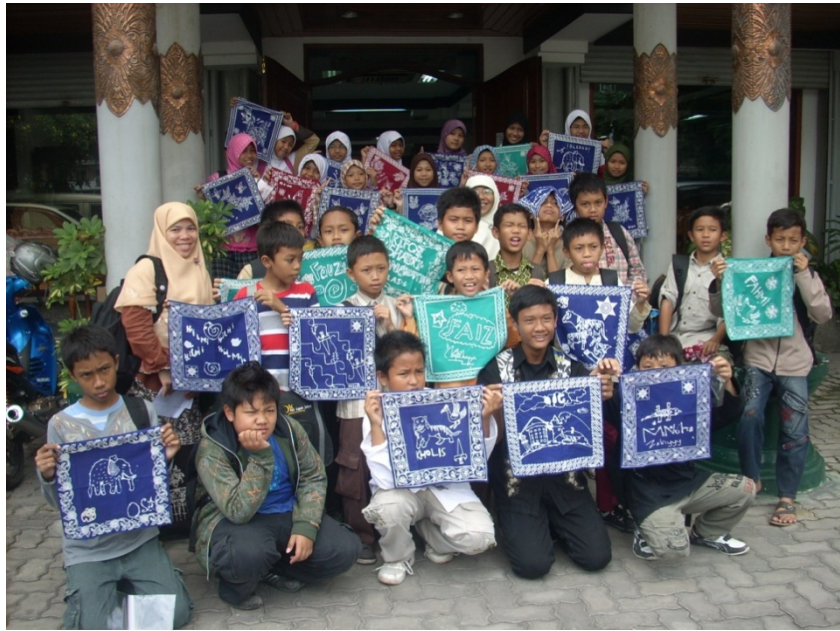
Doc. Membatik di Wonosostro, Bantul