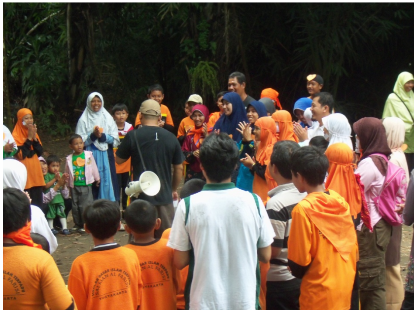
Doc. Rihlah dan Motivasi