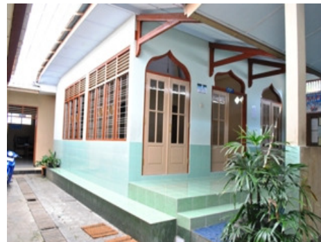
Gambar 10. Mushola sekolah tempat ibadah para siswa kelas 1 sampai dengan kelas 3