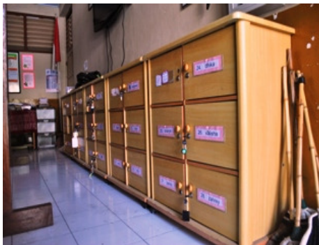
Gambar 15. Loker kelas tempat para siswa meletakkan barang pribadi, telah dilengkapi dengan kunci dan nama siswa