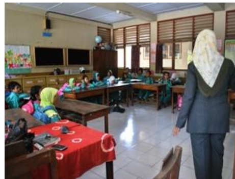
Gambar 22. Ruang Kelas