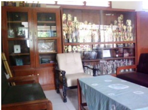
Gambar 3. Ruang Kepala Sekolah