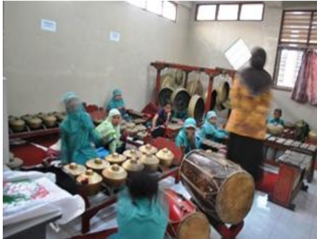
Gambar 19. Ruang Kesenian yang berisi Seperangkat Gamelan