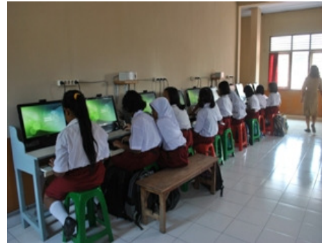
Gambar 8. Laboratorium komputer dengan jumlah komputer yang cukup memadai, rata-rata 1 perangkat untuk 1 siswa