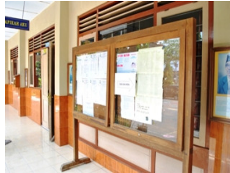
Gambar 14. Papan pengumuman yang terletak persis di depan ruang kepala sekolah