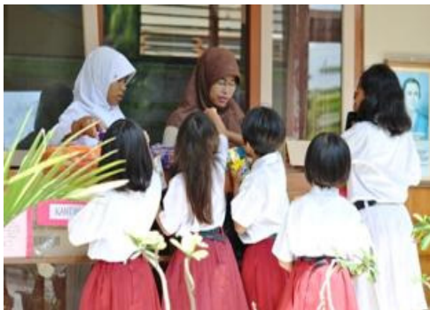
Gambar 9. Kantin kejujuran yang terletak di depan ruang guru, untuk sementara guru masih harus menunggui kantin tersebut