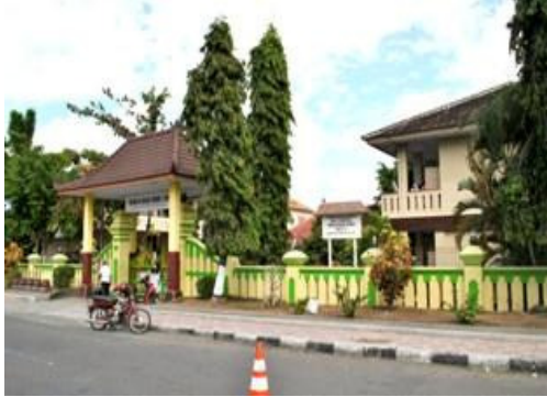
Gambar 1. Gerbang depan sekolah