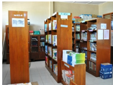
Gambar 6. Perpustakaan