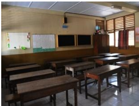
Gambar 21. Ruang Kelas Keadaan Kosong