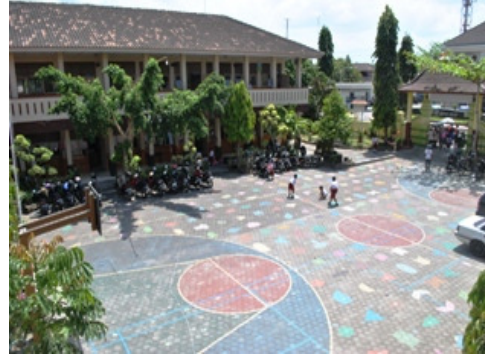
Gambar 2. Halaman sekolah