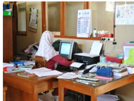
Gambar 16. Ruang karyawan yang terletak di satu gedung dengan perpustakaan sekolah