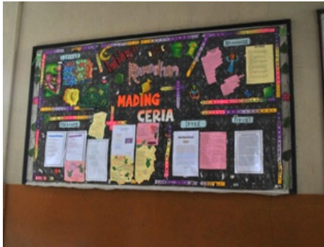
Gambar 13. Majalah dinding sekolah, sedikit disayangkan letaknya yang kurang strategis