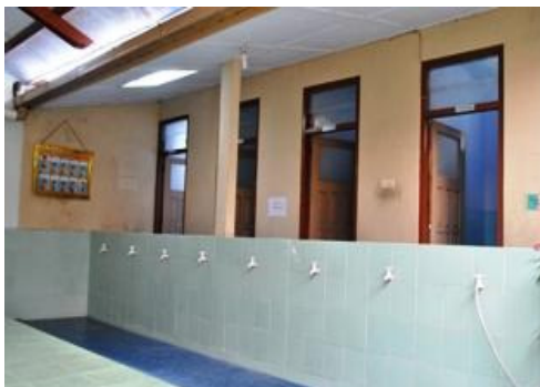
Gambar 5. Kamar mandi dan tempat wudlu yang tampak bersih