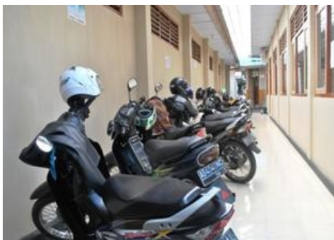
Gambar 11. Tempat parkir guru dan karyawan yang terletak di antara gedung laboratorium guru dan gedung yang digunakan sebagai ruang kepala sekolah