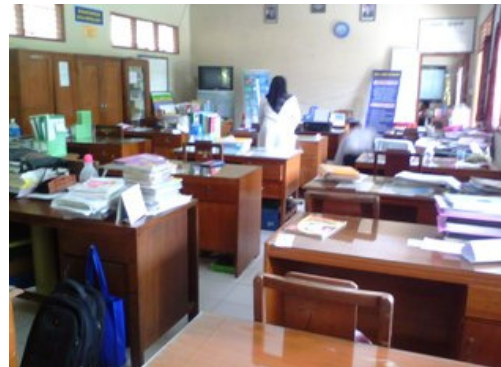
Gambar 4. Ruang Guru