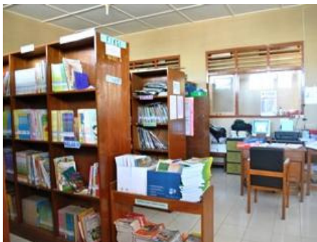
Gambar 23. Ruang Perpustakaan