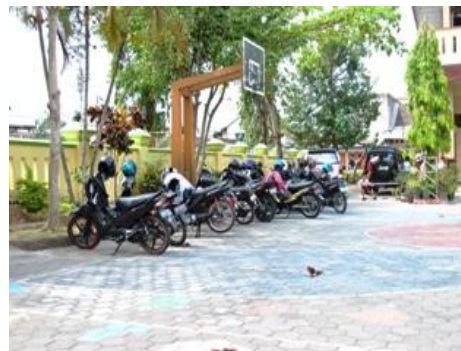
Gambar 24. Halaman Sekolah yang Dimanfaatkan Sebagai Tempat Parkir Tamu Sekolah