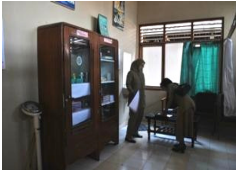
Gambar 7. Ruang UKS dilengkapi dengan dua buah tempat tidur dan almari tempat menyimpan peralatan