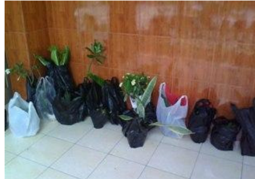
Gambar 20. Tanaman Hasil Sumbangan Siswa