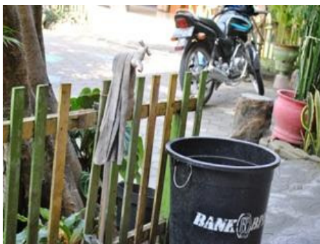
Gambar 17. Keran air dan tempat sampah, terdapat hamper di depan semua kelas