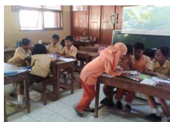
Siswa berdiskusi dengan anggota kelompoknya.