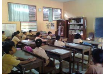
Guru bertanya masalah kontekstual sebagai kegiatan konstruktivisme.