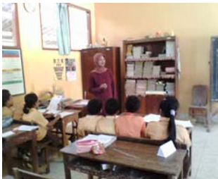
Guru melakukan refleksi.