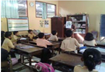
Siswa diperlihatkan gambar-gambar koperasi.