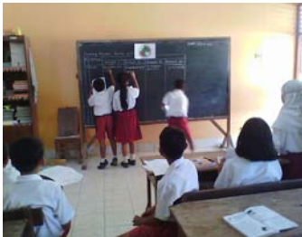
Siswa menuliskan hasilnya di papan tulis.