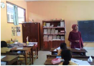
Guru melakukan apersepsi.