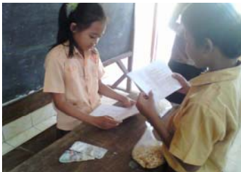
Siswa memainkan peran kegiatan suatu koperasi.