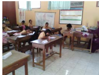
Siswa mengerjakan soal kognitif yang diberikan guru.