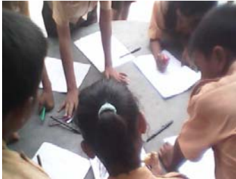
Siswa melakukan berdiskusi kelompok.