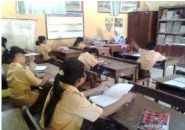
Siswa mengerjakan soal kognitif yang diberikan guru.