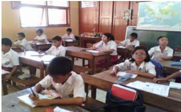
Siswa mengerjakan soal kognitif yang diberikan guru.