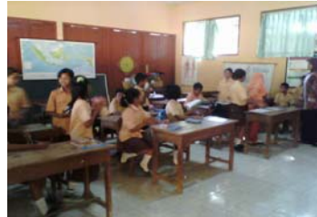
Siswa bergabung dengan kelompok.