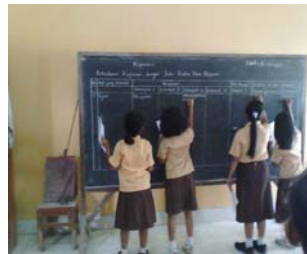
Siswa menuliskan hasilnya di papan tulis.