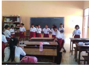
Siswa bergabung dengan kelompok.