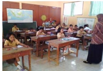
Siswa mengerjakan soal kognitif yang diberikan guru.