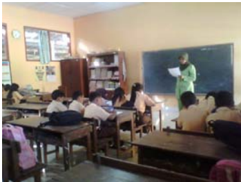
Siswa melakukan wawancara dengan petugas koperasi.