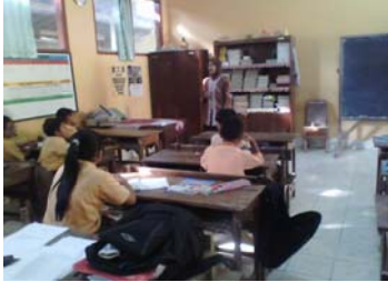
Guru melakukan apersepsi.