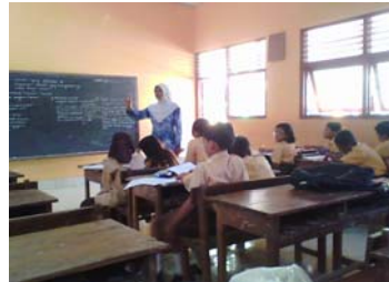
Guru melakukan refleksi.