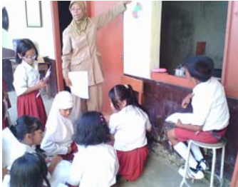
Siswa melakukan wawancara dengan petugas koperasi.