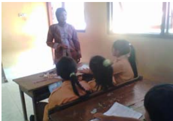
Guru melakukan refleksi.