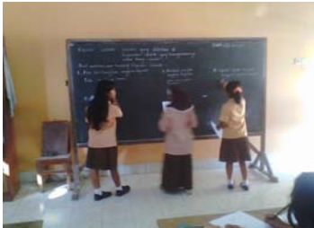
Siswa yang menyampaikan hasilnya.