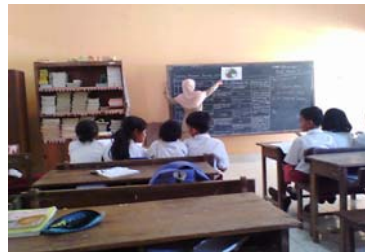
Guru melakukan refleksi.