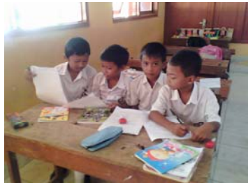
Siswa melakukan diskusi kelompok.