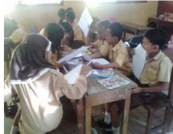
Siswa melakukan diskusi kelompok.