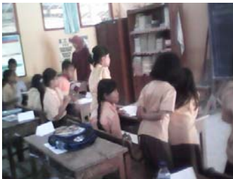
Siswa bergabung dengan kelompok.