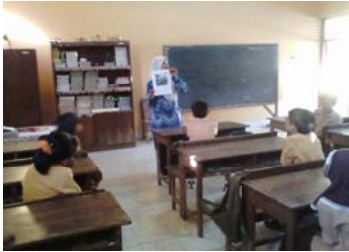
Siswa ditunjukkan gambar contoh koperasi sambil diberi penjelasan.