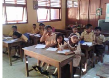
Siswa bergabung dengan kelompok.