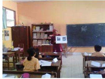
Siswa ditunjukkan gambar contoh koperasi dan jenis usaha lainnya.