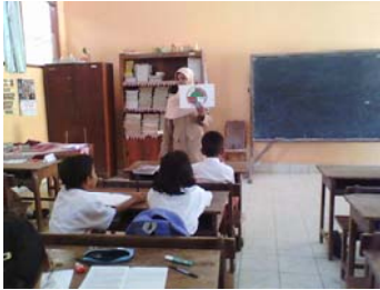
Siswa ditunjukkan contoh gambar lambang koperasi dan diberikan penjelasan.