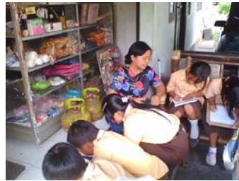
Siswa melakukan wawancara dengan penjaga warung.