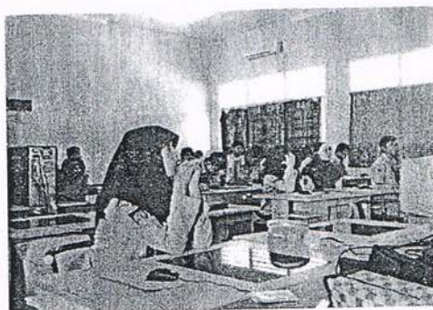
Pelaksanaan program belajar