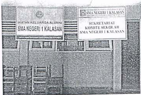
Ruang Komite Sekolah