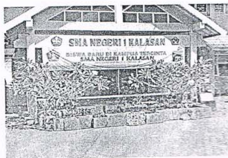
SMA Negeri 1 Kalasan