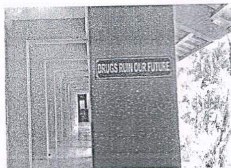
Slogan di Sekolah