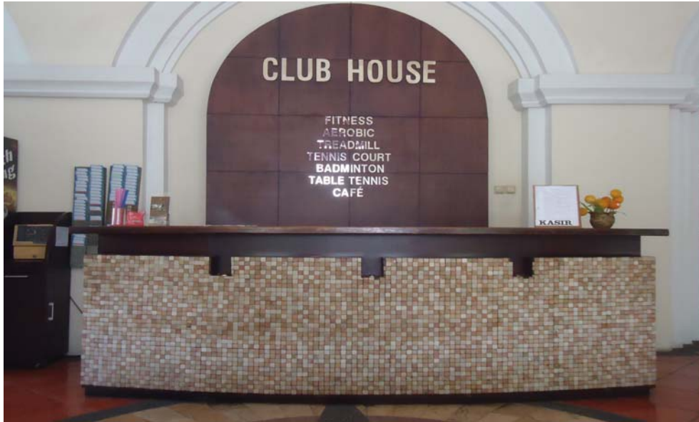
Gambar 1. Receptionist Casa Grande Club House