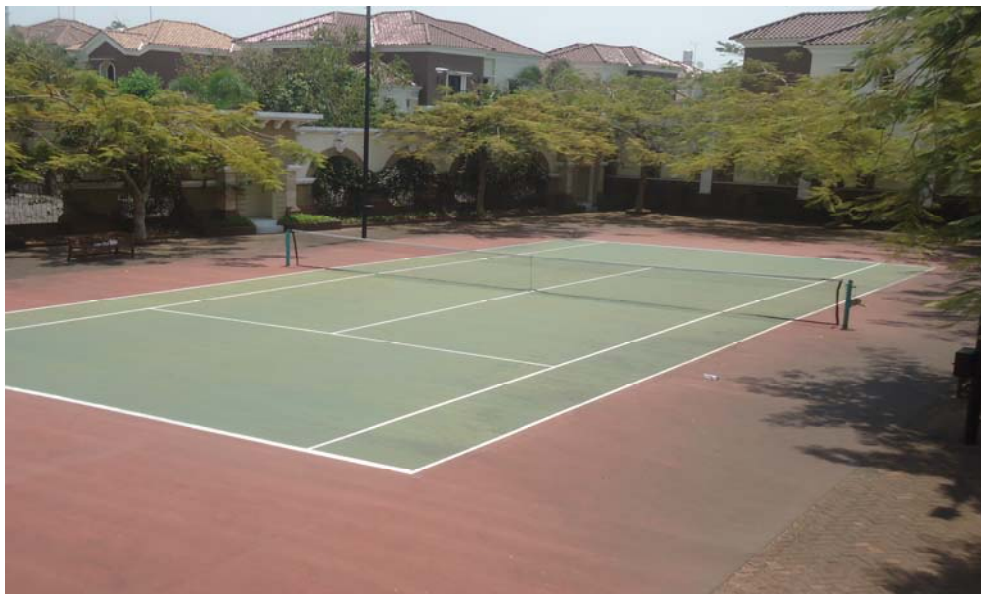
Gambar 4. Lapangan Tenis Casa Grande Club House