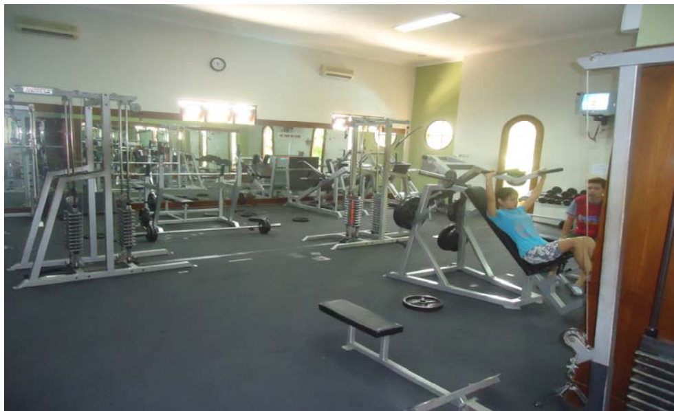
Gambar 2. Ruangan Fitness Casa Grande Club House