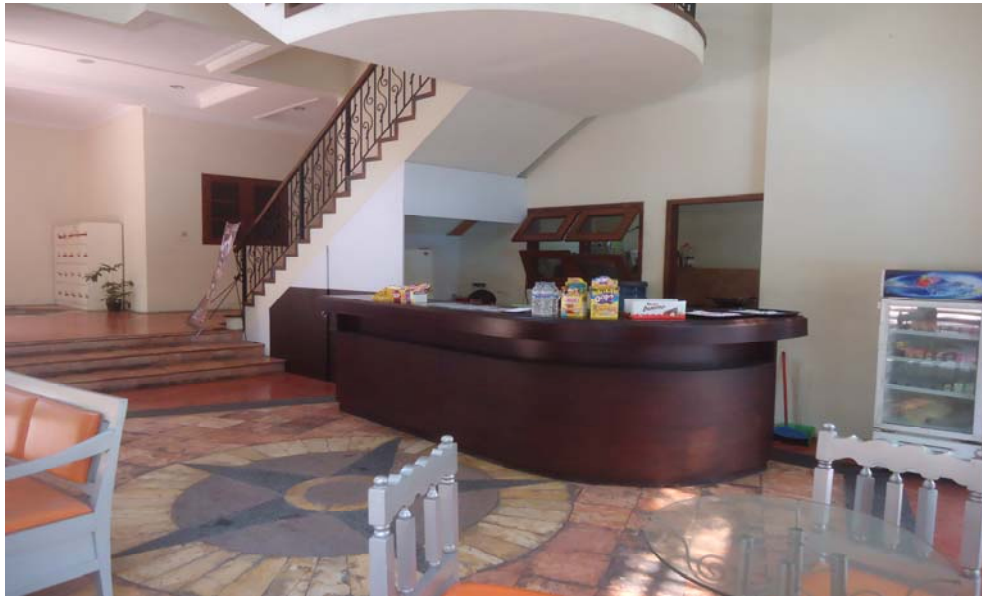
Gambar 5. Kantin Casa Grande Club House