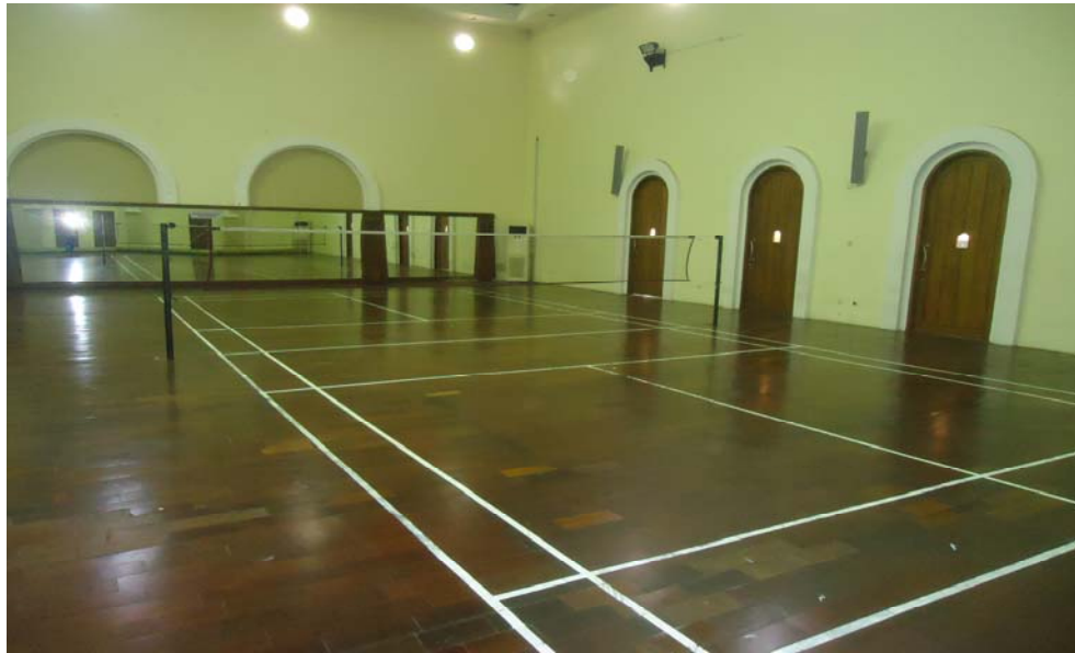
Gambar 3. Lapangan Bulutangkis Casa Grande Club House