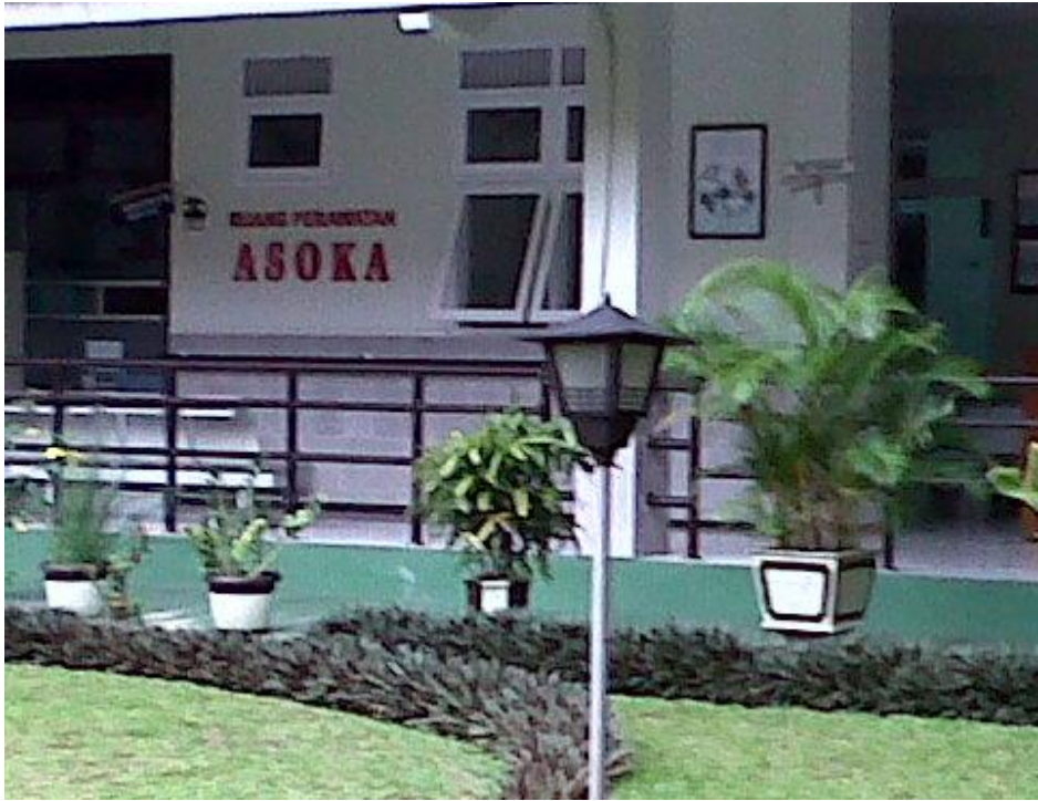
Ruang Jaga Perawat