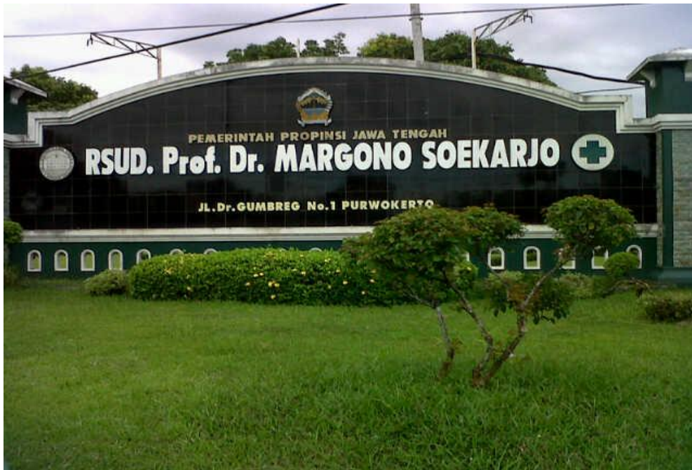
Rumah Sakit Umum Daerah Prof. Dr. Margono Soekarjo Purwokerto