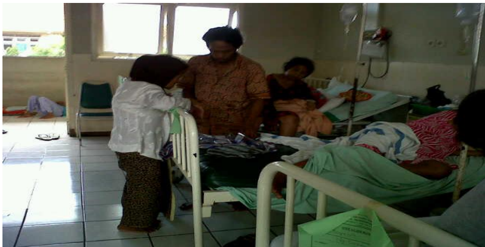
Ruang Rawat Inap Kelas III