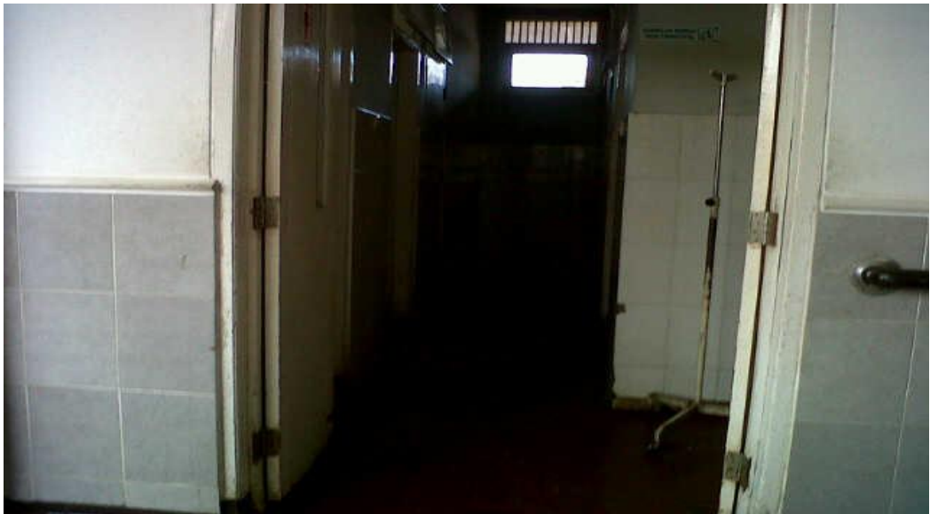
Kamar Mandi Kelas III