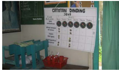
Hasil catatan kedisiplinan subyek JK.