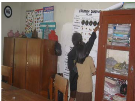
Subyek saat mengevaluasi sikap kedisiplinan bersama teman-teman.