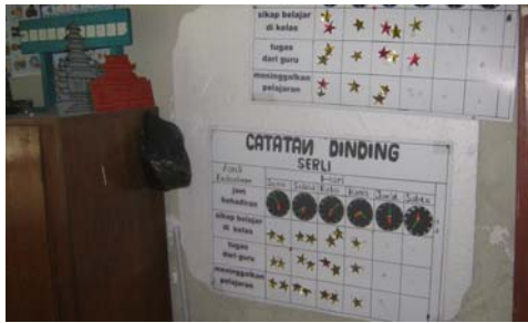
Hasil catatan kedisiplinan subyek SRL dan FJR.