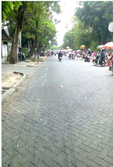
Lalu Lintas di Seberang Jalan Lokasi Pasar Tiban Sunday Morning