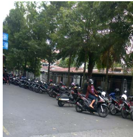
Lahan parkir di Pasar Tiban Sunday Morning