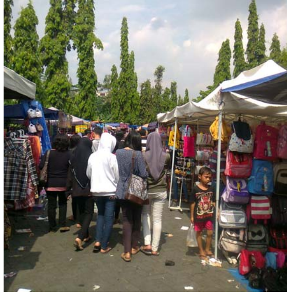
Aktivitas di Pasar Tiban Sunday Morning