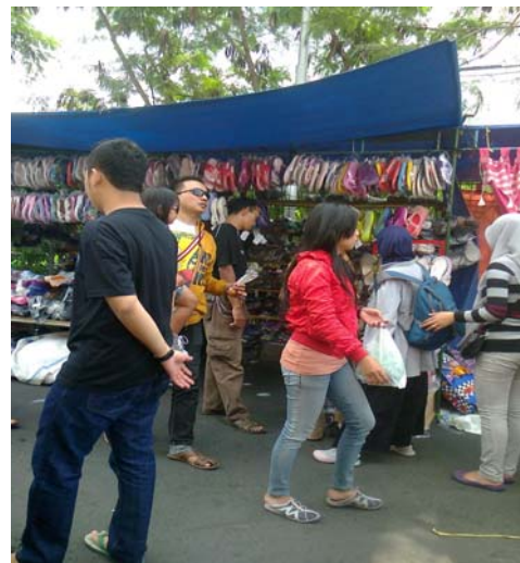
Aktivitas di Pasar Tiban Sunday Morning