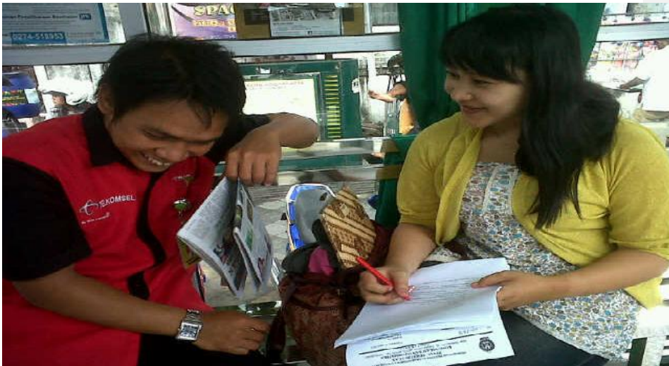
Gambar 2. Saat wawancara dengan salah satu pegawai halte bus Trans Jogja(dokumentasi pribadi diambil pada tanggal 20 Maret 2012 pukul 08.00)