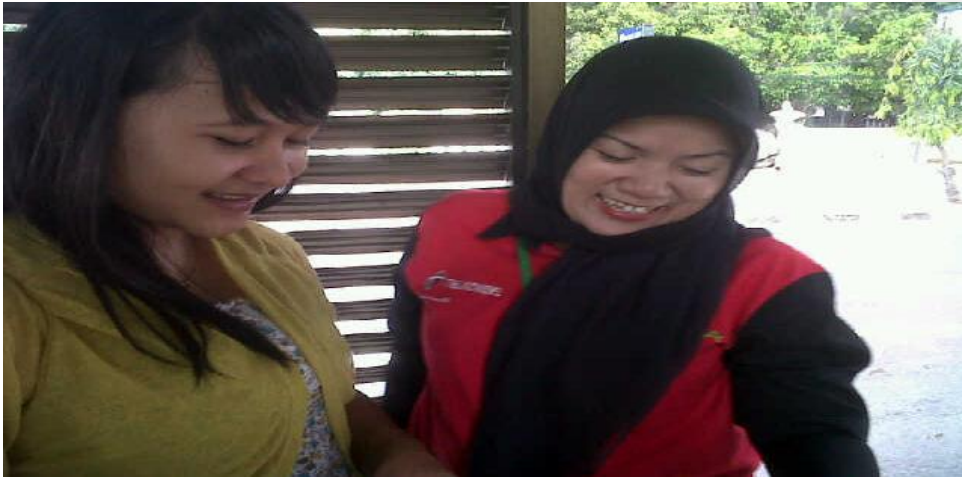
Gambar 3. Saat wawancara dengan salah satu pegawai halte bus Trans Jogja