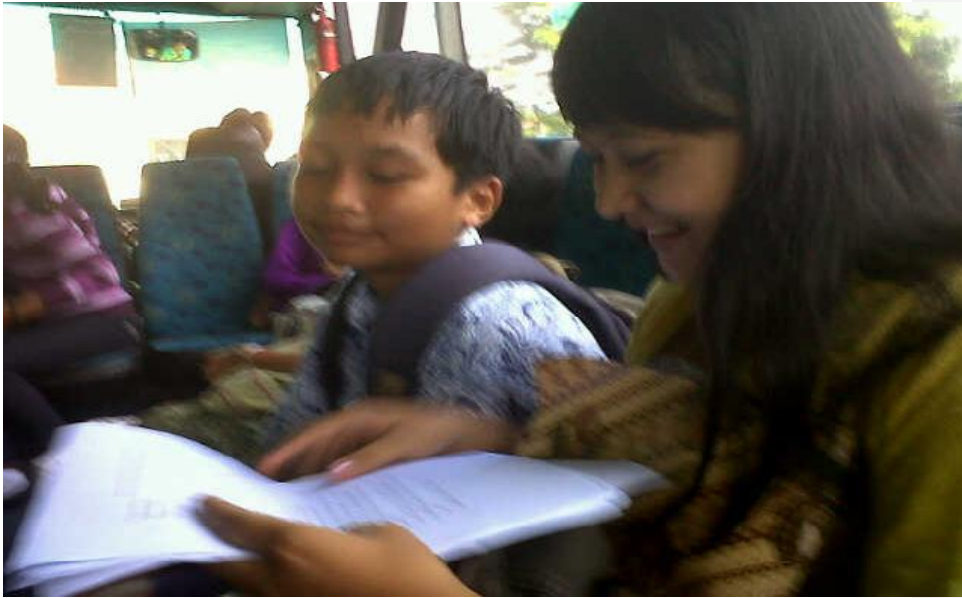
Gambar 1. Saat wawancara dengan penumpang bus Trans Jogja