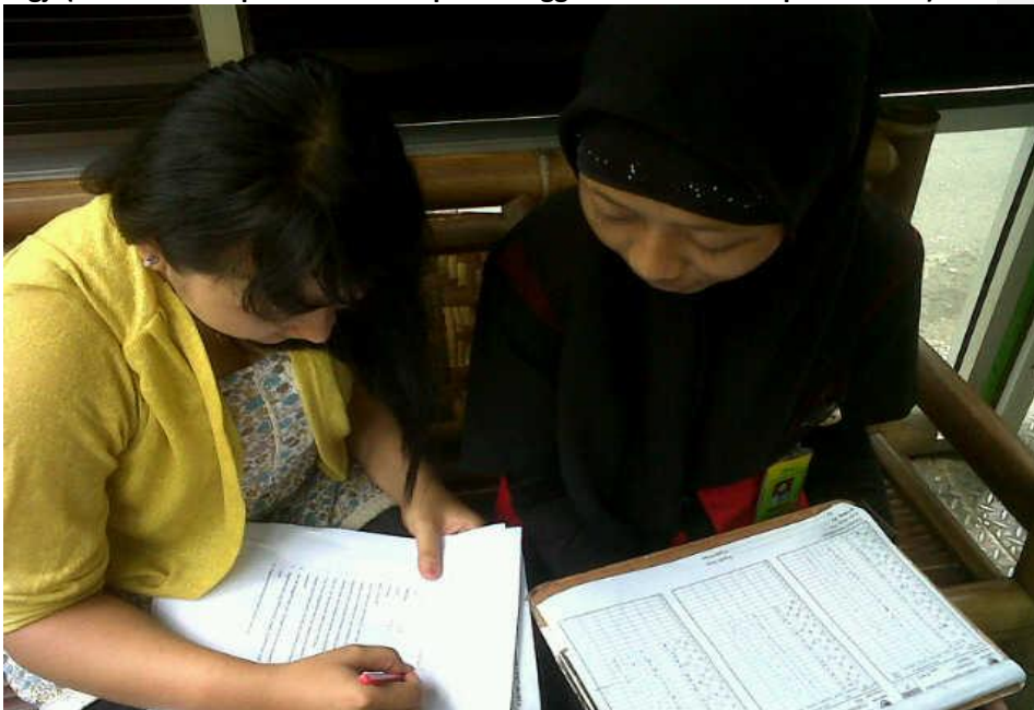
Gambar 3. Saat wawancara dengan salah satu pegawai halte bus Trans Jogja