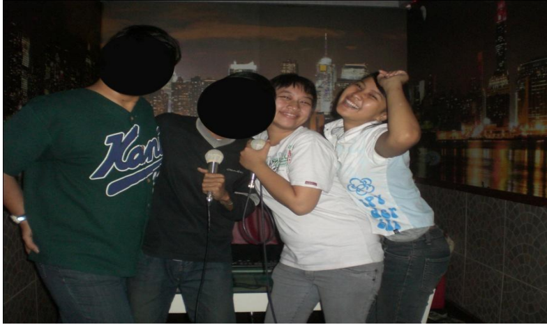
Saat observasi dan wawancara para homoseksual bernyanyi