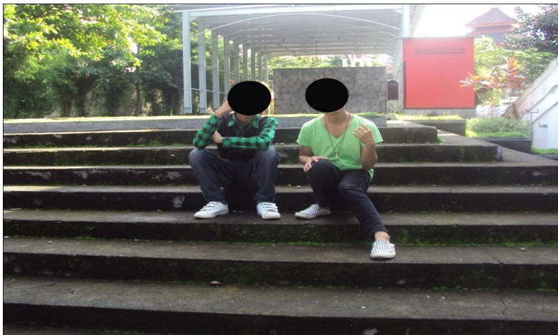
Saat observasi menyaksikan even yang bertemakan homoseksual.