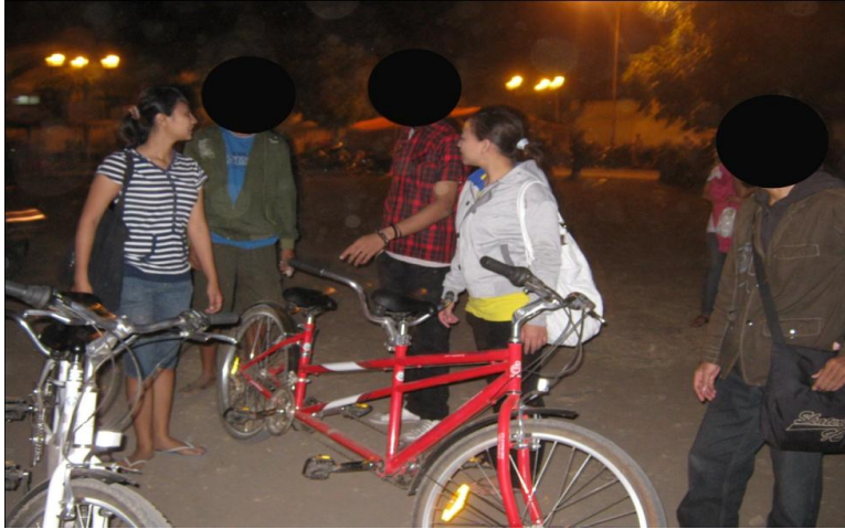
saat sedang observasi dan wawancara di alun-alun Yogyakarta