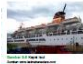
Gambar 3. Kapal

Transportasi laut ada yang bermesin dan tidak bermesin. Contoh tidak bermesin, seperti perahu dayung, kapal layar, dan sebagainya. Adapun yang bermesin adalah kapal laut. Kapal laut ada yang berukuran besar dan kecil. Kapal yang besar dapat mengangkut bus, truk, dan sebagainya. Perakitan kapal di dalam negeri, yaitu PT PAL di Surabaya (Jawa Timur). Adapun PT PelnI merupakan perusahaan pemerintah yang mengelola transportasi laut.