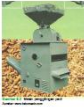
Gambar 1. Mesin penggilingan padi