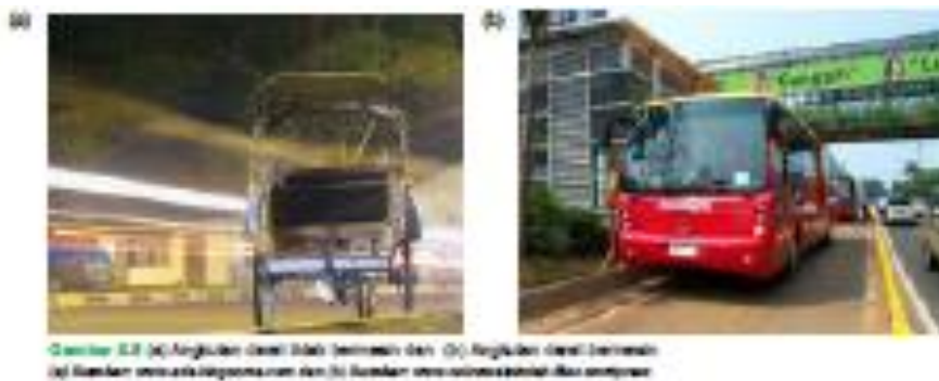
Gambar 2. Becak dan Bus

Sarana angkutan melalui jalan darat disebut transportasi darat. Angkutan darat dibedakan menjadi dua jenis, yaitu bermesin dan tidak bermesin. Angkutan tidak bermesin bersifat tradisional. Berlangsung sejak dahulu. Misalnya, sepeda, becak, delman, gerobak, dan sebagainya. Transportasi yang tidak menggunakan mesin umumnya menggunakan hewan. Hewan-hewan itu biasanya hewan besar, seperti kuda, sapi, unta dan sebagainya.