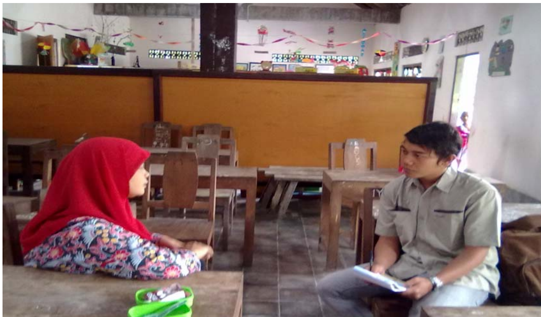
Gambar 2. Wawancara dengan ketua HIMPAUDI Kecamatan Turi yaitu Ibu En di tempat beliau mengajar yaitu di PAUD Taman Fajar.