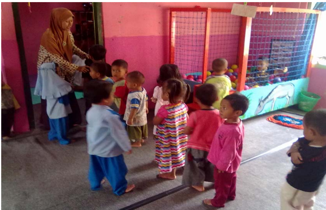
Gambar 5. Suasana di TPA Permata Hati, yaitu saat anak-anak sedang antri masuk ruang makan.