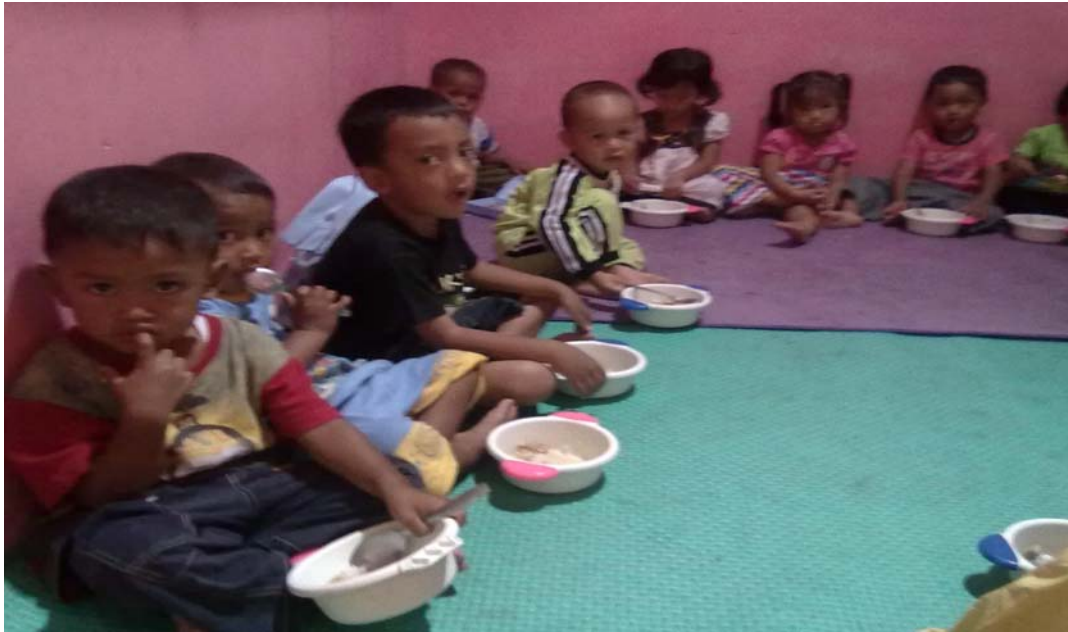
Gambar 3. Suasana di TPA Permata Hati, yaitu saat anak-anak makan siang bersama-sama.