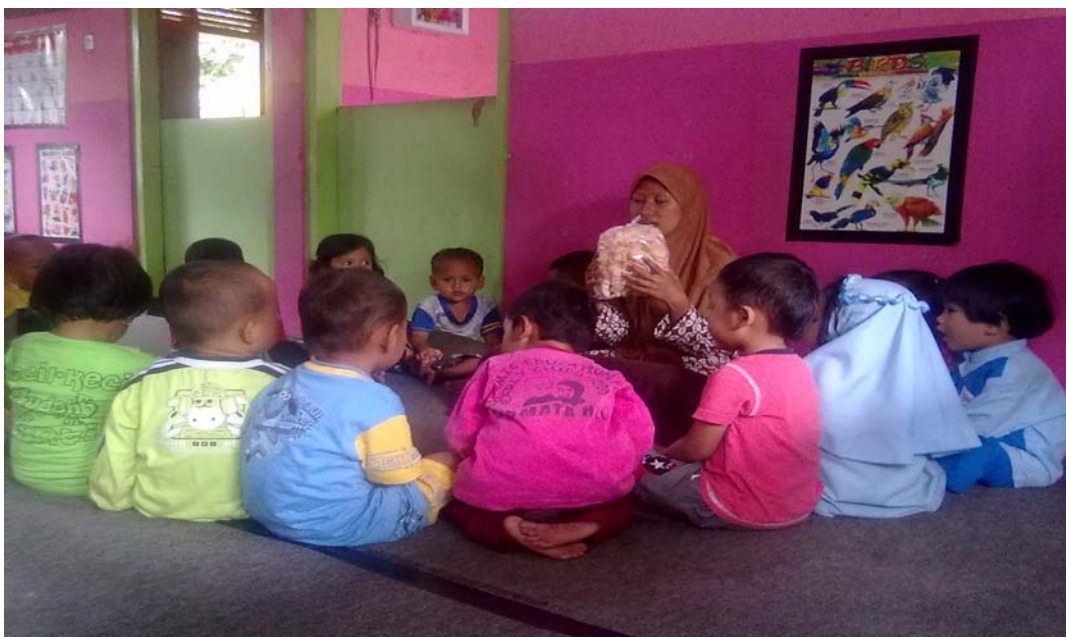
Gambar 8. Suasana di TPA Permata Hati, yaitu suasana saat berbagi makanan. (Dokumentasi pribadi diambil pada tanggal 9 Mei 2012)