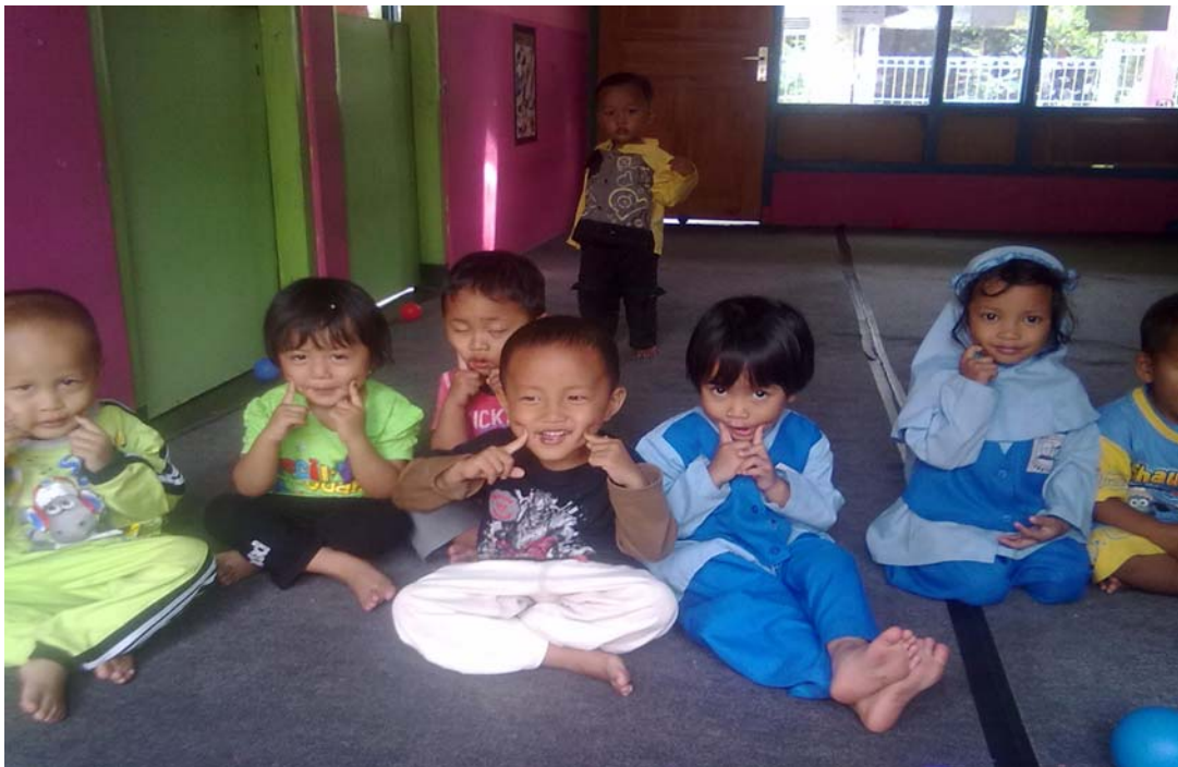
Gambar 6. Suasana kebahagiaan anak-anak di TPA Permata Hati.