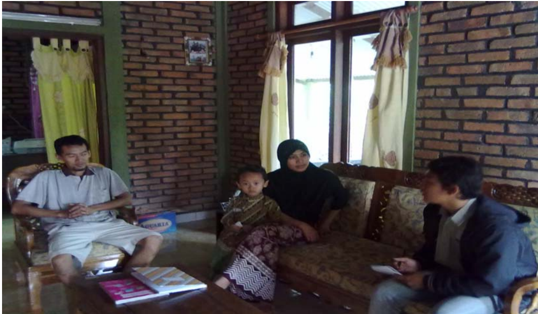
Gambar 1. Wawawancara dengan salah satu keluarga yang anaknya sekolah di lembaga pendidikan anak usia dini yaitu Ibu Ar dirumah pribadinya.