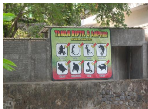
Papan taman reptile dan amphibian