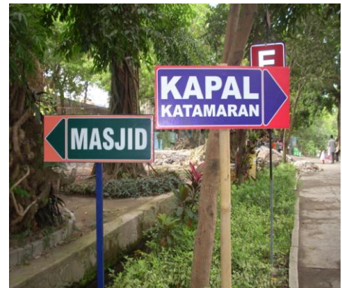
Papan penunjuk arah