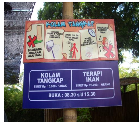
Papan peraturan kolam tangkap