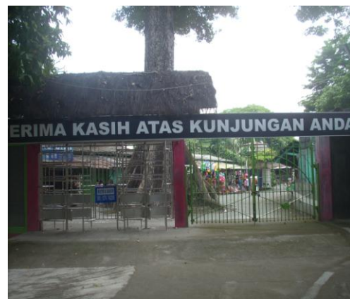
Papan terima kasih