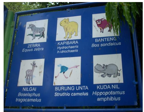
Papan nama binatang