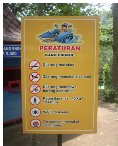
Papan peraturan wahana kano engkol