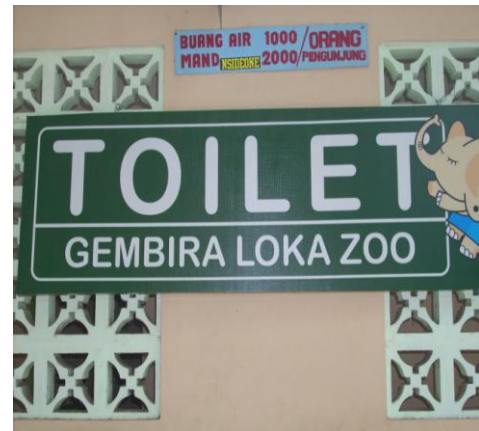
Papan nama fasilitas umum