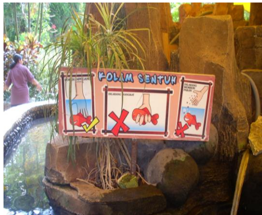
Papan peraturan kolam sentuh