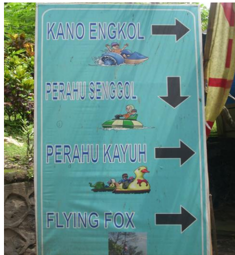
Papan arah wahana