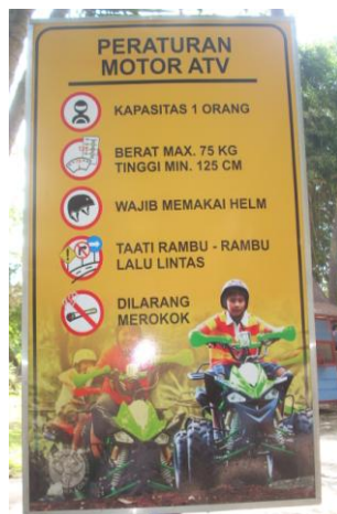
Papan peraturan motor ATV