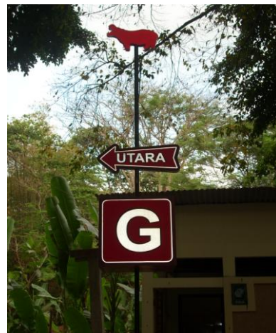
Papan arah rute