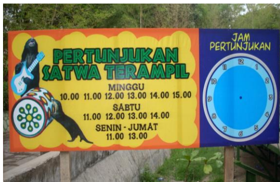
Papan informasi wahana baru