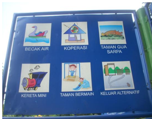
Papan fasilitas umum