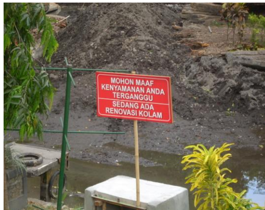
Papan informasi renovasi