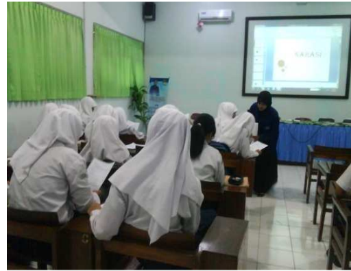
Gambar 8: Peneliti Ikut Berpartisipasi dalam Proses Pembelajaran