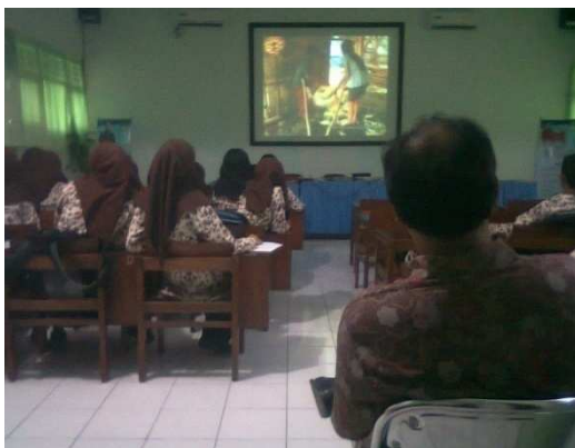
Gambar 5: Siswa melihat tayangan “Jika Aku Menjadi”