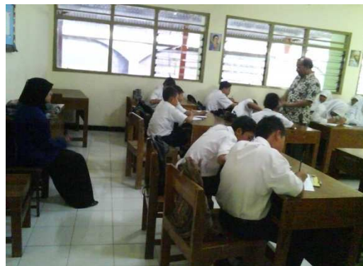
Gambar 11: Peneliti Mengamati Suasana Pembelajaran