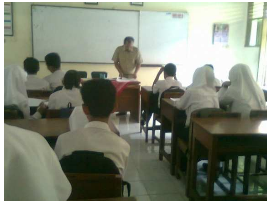
Gambar 4: Guru Menjelaskan Pelajaran