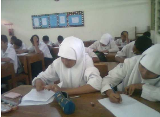
Gambar 1: Pretest Kelompok Kontrol