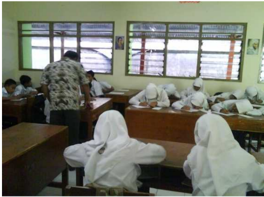
Gambar 7: Pembelajaran di Kelas Kontrol