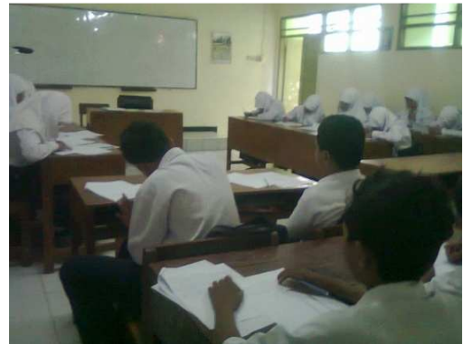
Gambar 10: Posttest Kelompok Eksperimen