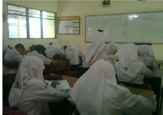
Gambar 2: Pretest Kelompok Eksperimen