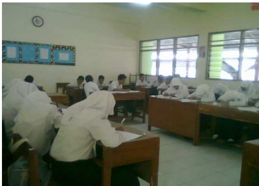
Gambar 9: Posttest Kelompok Kontrol