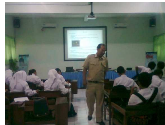
Gambar 6: Suasana Pembelajaran di Kelas Eksperimen