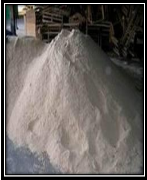
Hasil Penggilingan Batu Kapur (Mill)