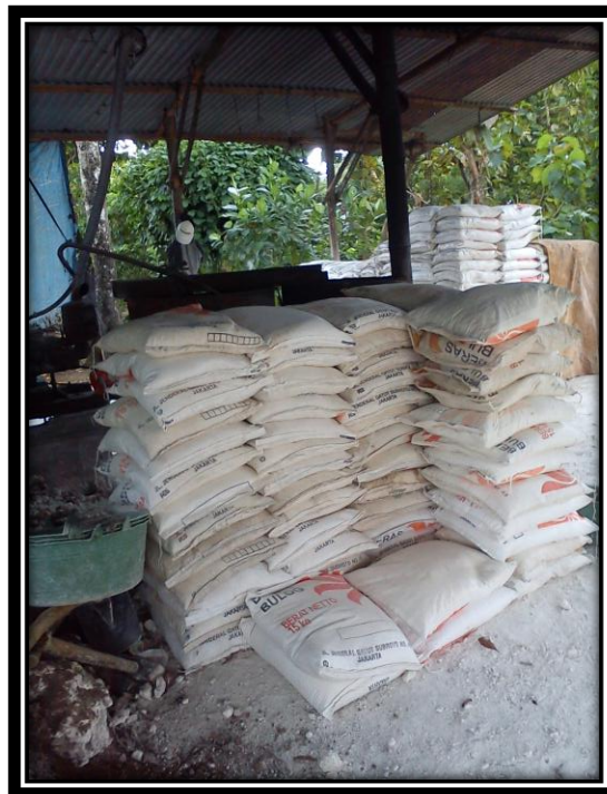
Produk Olahan Batu Kapur (Mill)