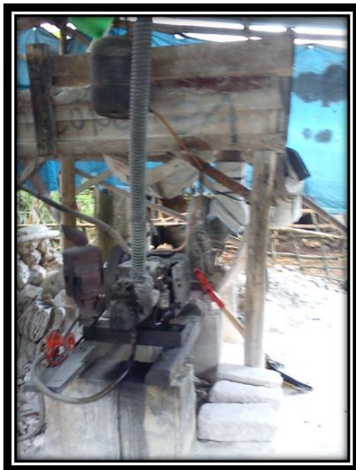
Proses Penggilingan Batu Kapur