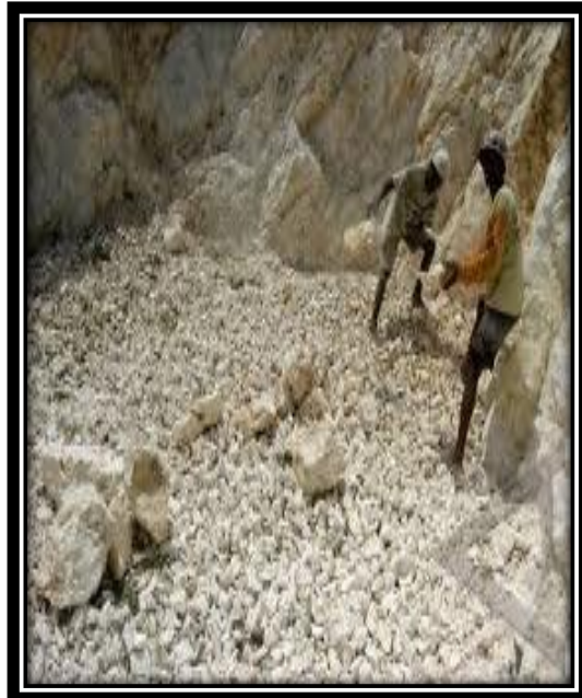
Kegiatan Penambangan Batu Kapur