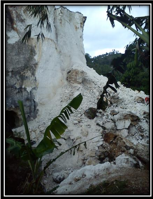
Lahan Penambangan Batu Kapur