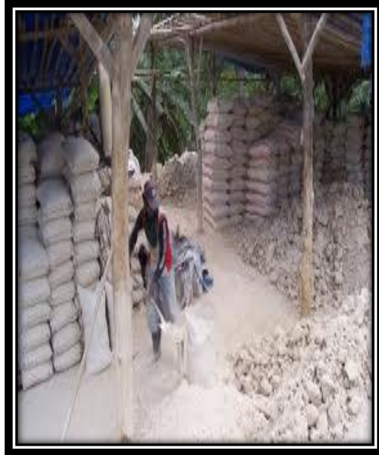
Pengepakan Olahan Batu Kapur (Mill)