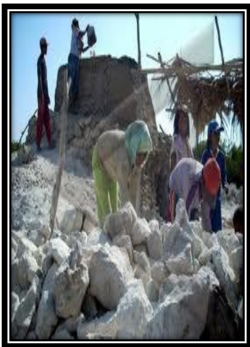
Proses Pemilahan Batu Kapur