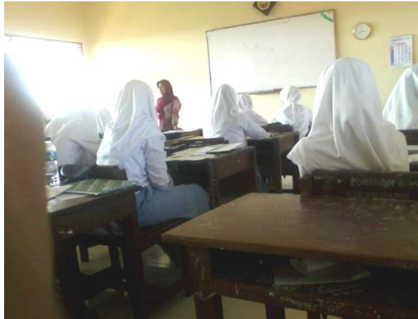
Gambar 3. Pembelajaran Sebelum Penerapan Metode Pembelajaran Kooperatif Teknik Think Pair Share (TPS)