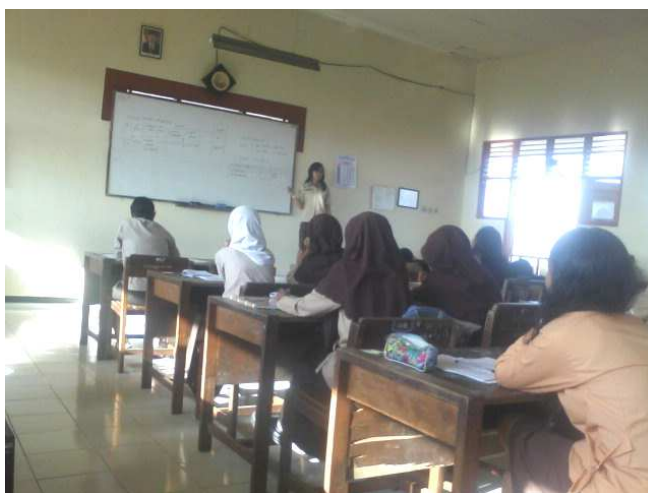
Gambar 5. Tahap Share