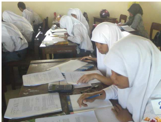
Gambar 5. Tahap Pair