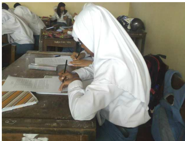
Gambar 4. Tahap Think