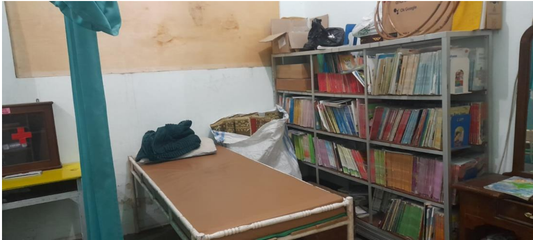
FOTO UKS MIN 1 SLEMAN