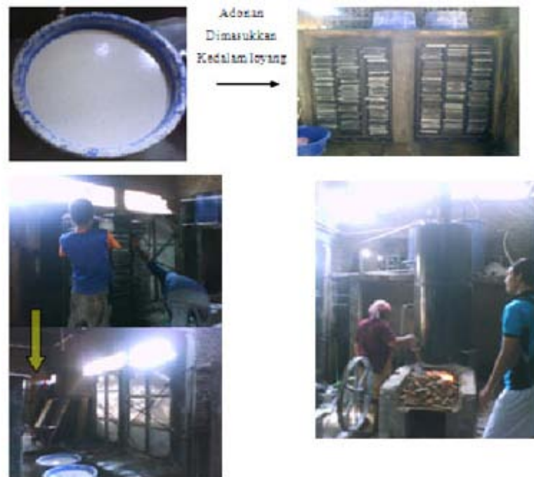
Gambar 2. Proses Pengukusan (tahap ke-2)