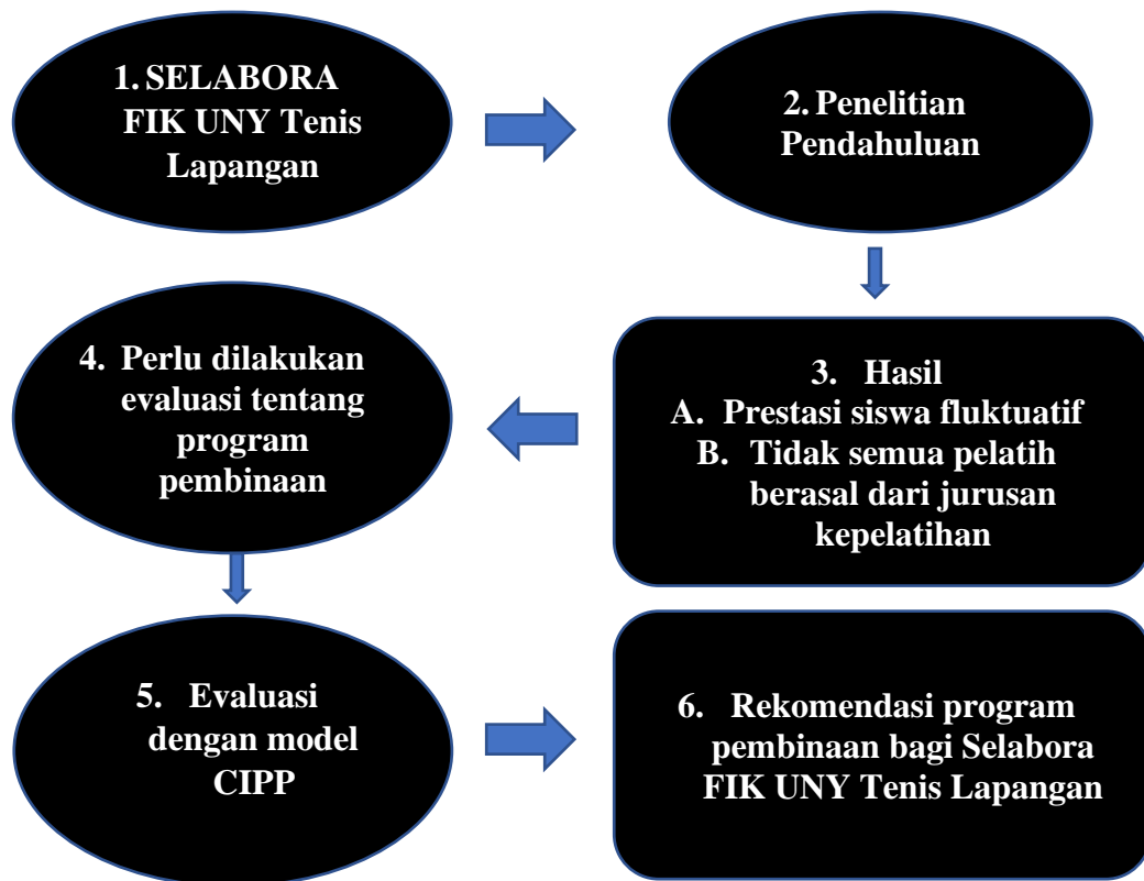
Gambar 1. Bagan Kerangka Pikir Penelitian