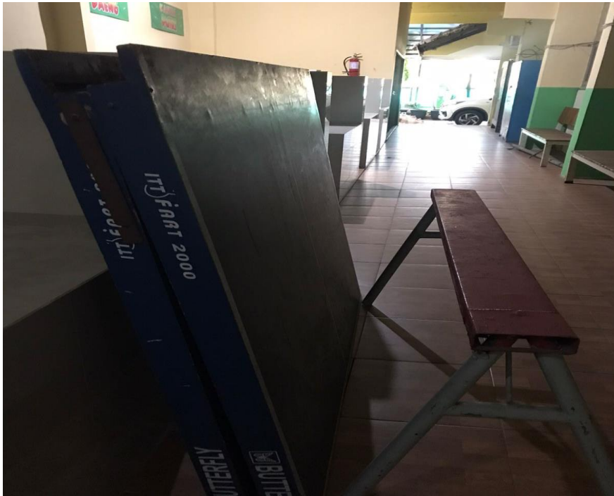
Gambar 1. Tempat penyimpanan meja tenis

Berdasarkan hasil observasi di SMP Negeri 277 Jakarta, peneliti melihat meja tenis yang disimpan di lorong sekolah arah menuju kantin yang membuat meja menjadi cepat berdebu dan cepat rusak karena terkena tampias dari ait hujan. Peneliti juga melihat peralatan tenis meja yang disimpan di tempat yang sangat kotor membuat peralatan tenis meja seperti bet atau bola menjadi tidak awet dan menjadi tidak tahan lama ketika dimainkan oleh siswa