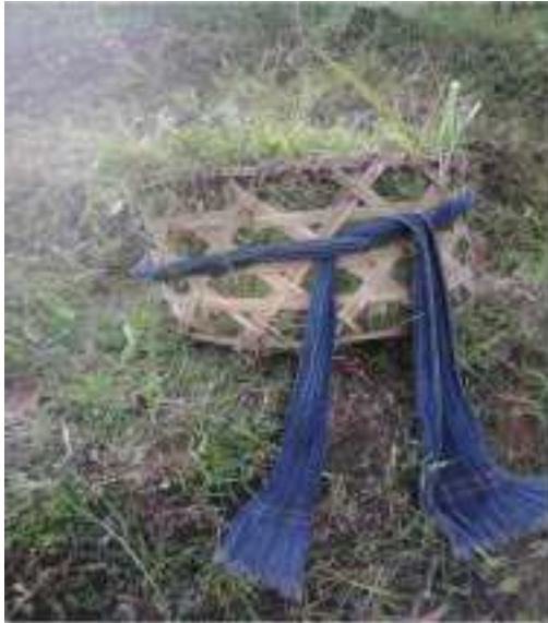
Gambar 46: Saperes