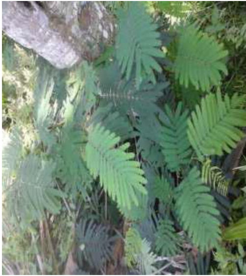
Gambar 31: Godhong Kalendra