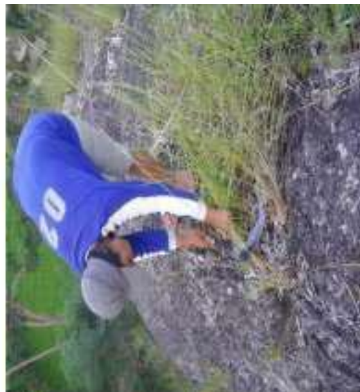
Gambar 18: Ngegres