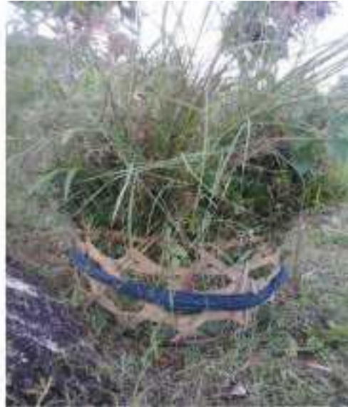
Gambar 47: Sajuju Sumber: Dok. Dian, Dhusun Ngangkruk 28 April 2018