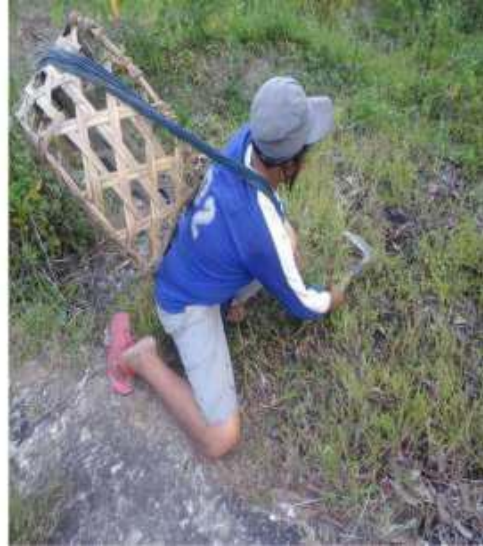
Gambar 16: Mbabad Sumber: Dok. Dian, Dhusun Ngangkruk 28 April 2018