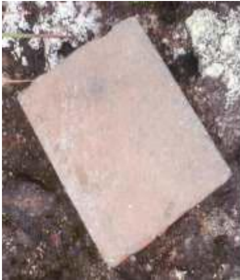
Gambar 3: Kolek Sumber: Dok. Dian, Dhusun Ngangkruk 04 Februari 2018