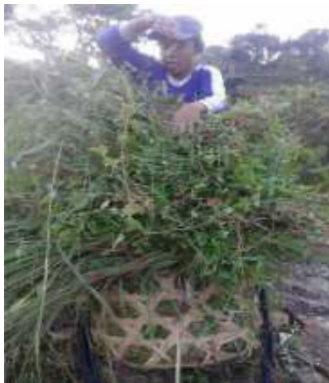
Gambar 48: Saumpang Sumber: Dok. Dian, Dhusun Ngangkruk 28 April 2018