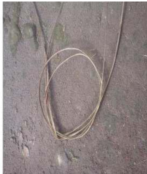
Gambar 10: Tali Pring