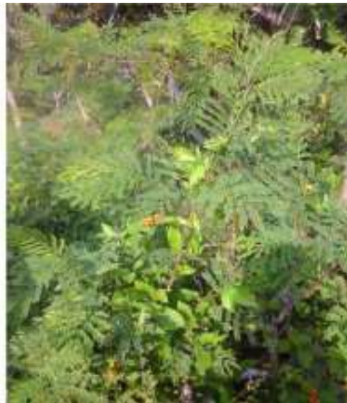
Gambar 35: Godhong Mlanding Sumber: Dok. Dian, Dhusun Ngangkruk 28 April 2018