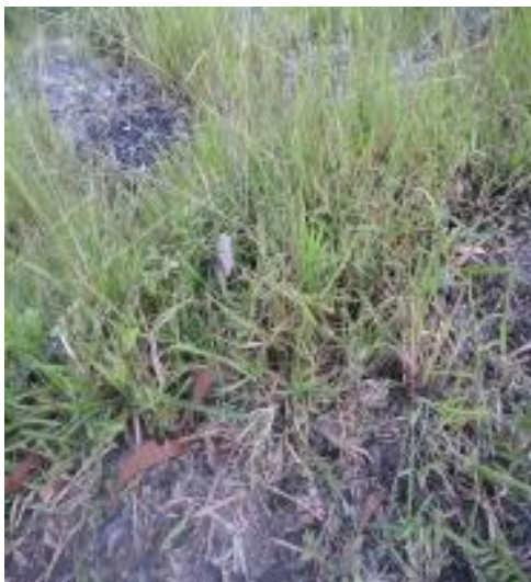
Gambar 22: Mbesen Sumber: Dok. Dian, Dhusun Ngangkruk 29 April 2018