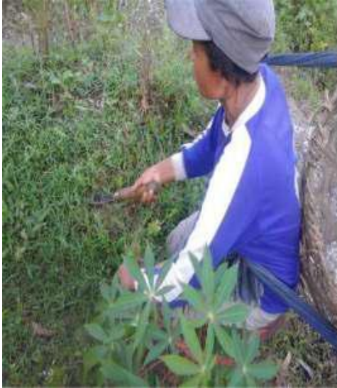
Gambar 15: Nyusruk