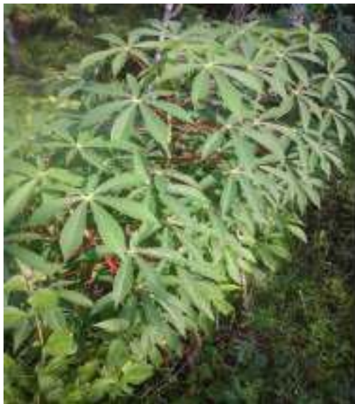
Gambar 30: Godhong Tela Sumber: Dok. Dian, Dhusun Ngangkruk 28 April 2018