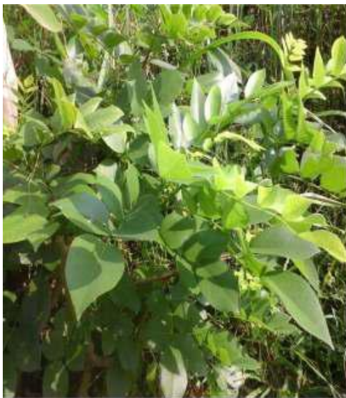
Gambar 26: Godhong Leresedhe Sumber: Dok. Dian, Dhusun Ngangkruk 28 April 2018