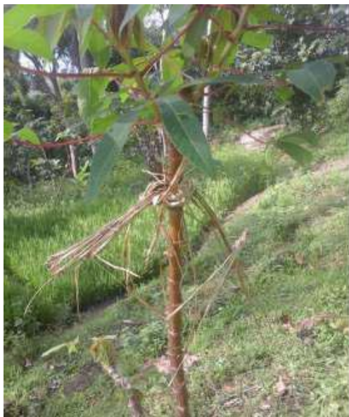
Gambar 42: Disaweni Sumber: Dok. Dian, Dhusun Ngangkruk 03 Februari 2018