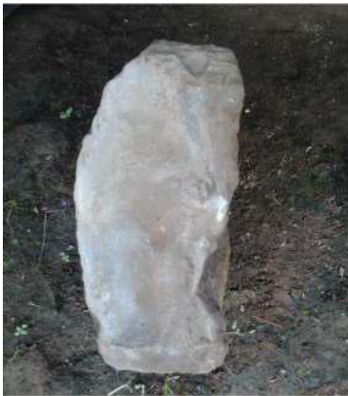
Gambar 7: Ungkal