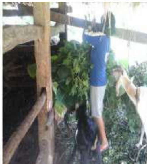
Gambar 50: Digandhulke Sumber: Dok. Dian, Dhusun Ngangkruk 28 April 2018