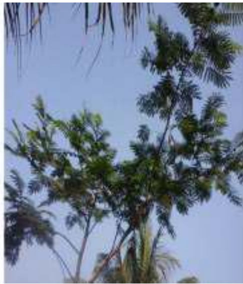
Gambar 29: Godhong Sengon Laut Sumber: Dok. Dian, Dhusun Ngangkruk 28 April 2018