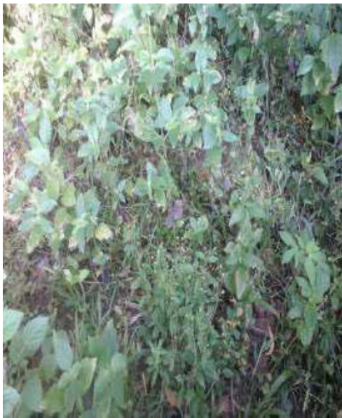
Gambar 24: Othok kowok Sumber: Dok. Dian, Dhusun Ngangkruk 30 April 2018