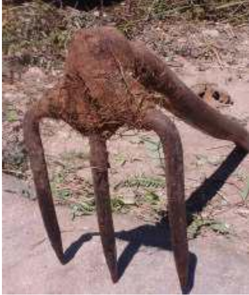
Gambar 11: cangkrang Sumber: Dok. Dian, Dhusun Ngangkruk 29 April 2018