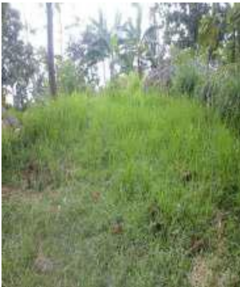
Gambar 41: ara-ara Sumber: Dok. Dian, Dhusun Ngangkruk 29 April 2018