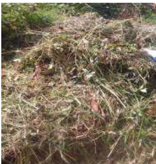
Gambar 51: Rapen Sumber: Dok. Dian, Dhusun Ngangkruk 28 April 2018