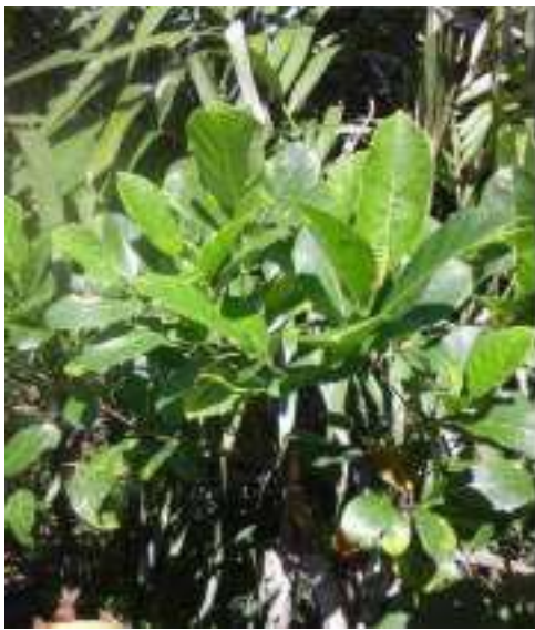
Gambar 27: Godhong Nangka Sumber: Dok. Dian, Dhusun Ngangkruk 28 April 2018