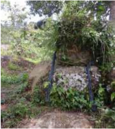
Gambar 40: Dipagolke Sumber: Dok. Dian, Dhusun Ngangkruk 29 April 2018