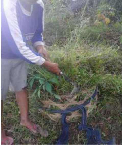
Gambar 36: Dijuju