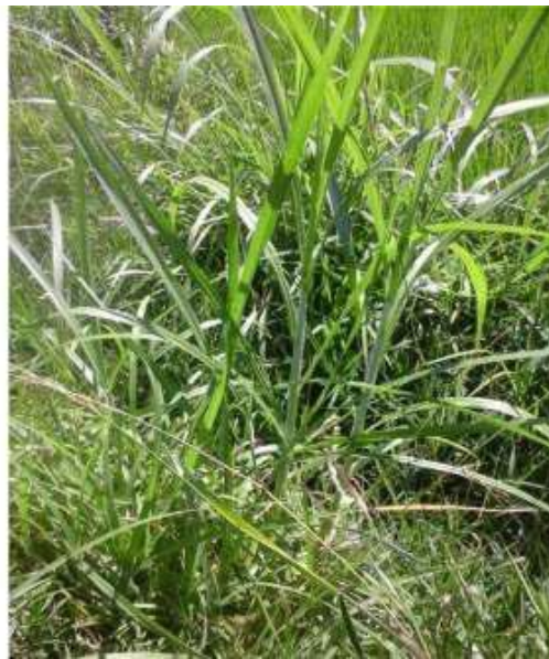
Gambar 25: Kalanjana Sumber: Dok. Dian, Dhusun Ngangkruk 29 April 2018