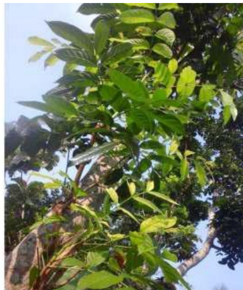
Gambar 28: Godhong Maoni Sumber: Dok. Dian, Dhusun Ngangkruk 28 April 2018