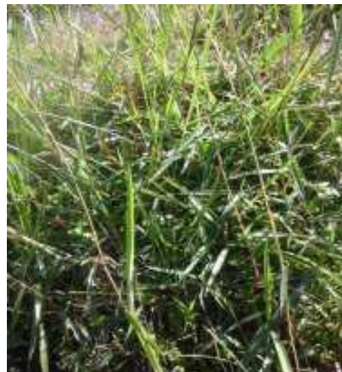
Gambar 23; Blembem Sumber: Dok. Dian, Dhusun Ngangkruk 29 April 2018