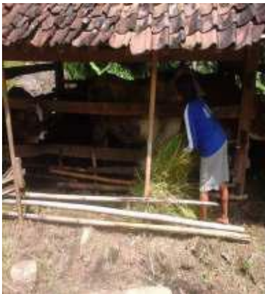
Gambar 49: Ngebruksi Sumber: Dok. Dian, Dhusun Ngangkruk 28 April 2018