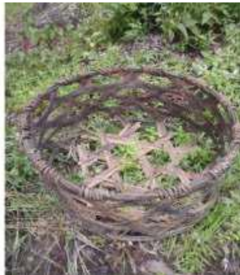
Gambar 6: Kranjang Sumber: Dok. Dian, Dhusun Ngangkruk 04 Februari 2018