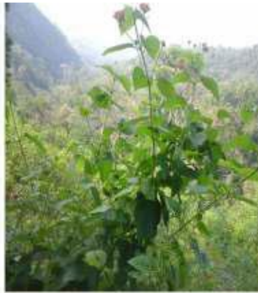
Gambar 32: Godhong Telekan