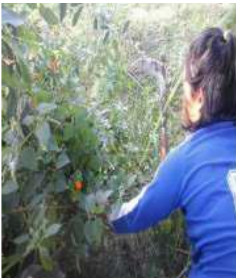
Gambar 17: Mecoki