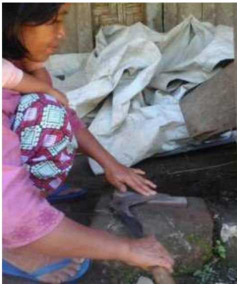
Gambar 13: Ngasah