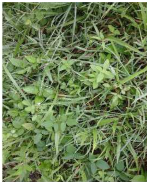
Gambar 43: Bun