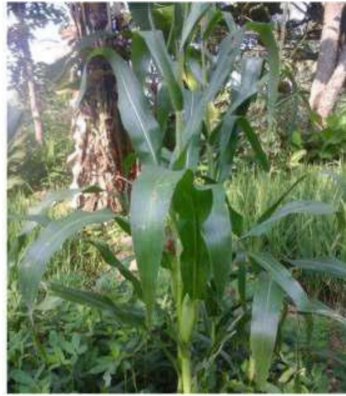
Gambar 33: Tebon Sumber: Dok. Dian, Dhusun Ngangkruk 28 April 2018