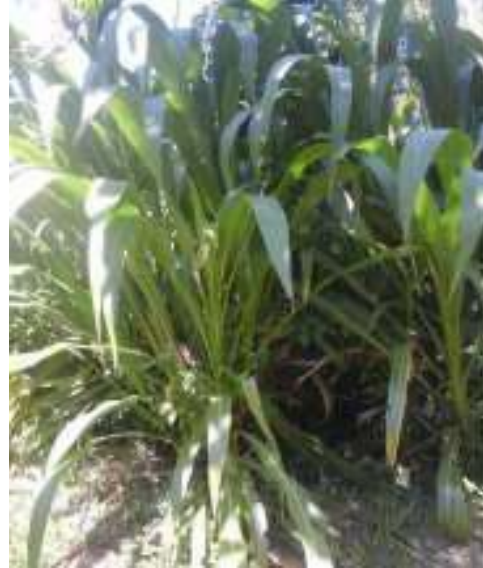
Gambar 21: Suket Gajahan