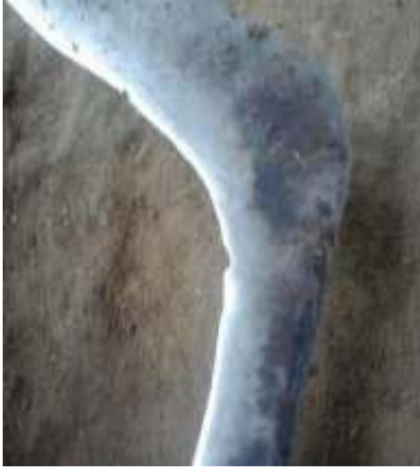
Gambar 12: Gowang Sumber: Dok. Dian, Dhusun Ngangkruk 29 April 2018 Kat: tempak saha kethul boten wonten gambaripun