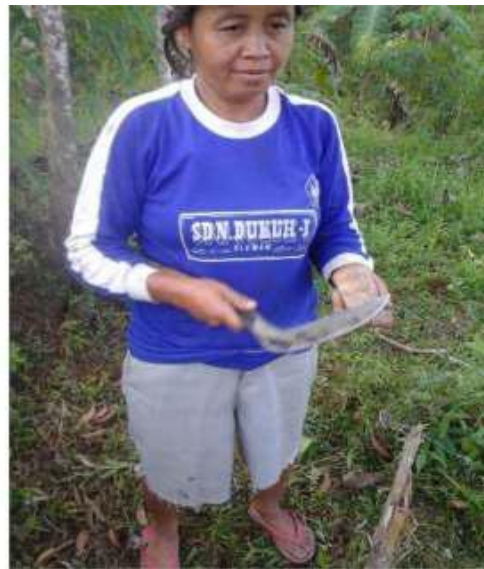
Gambar 14 : Ngolek Sumber: Dok. Dian, Dhusun Ngangkruk 28 April 2018