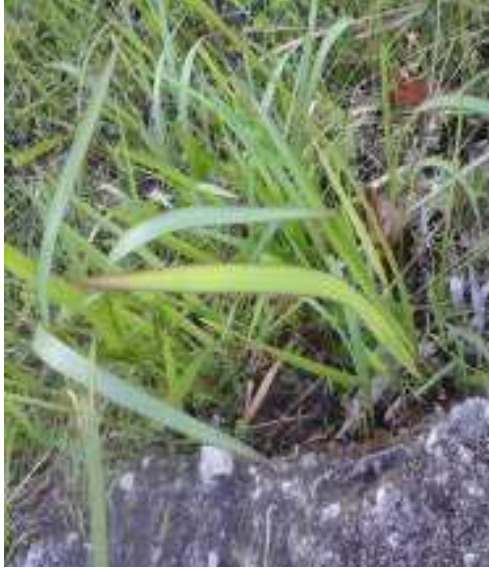
Gambar 19: Alang-alang