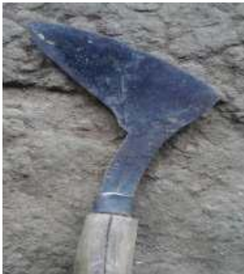
Gambar 4: Cengkong Sumber: Dok. Dian, Dhusun Ngangkruk 04 Februari 2018