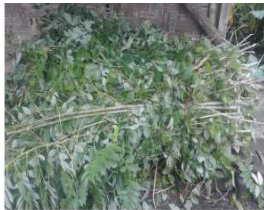
Gambar 39: Dipapak Dhusun Ngangkruk 29 April 2018