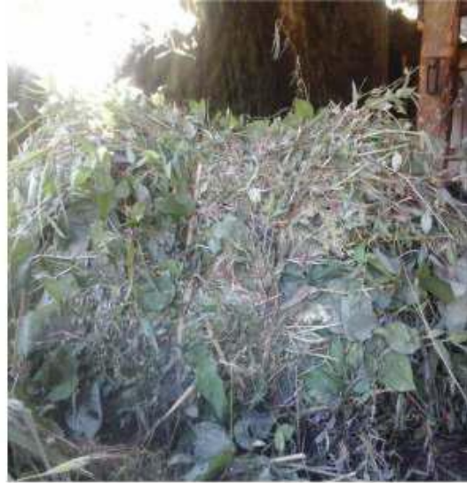
Gambar 38: Dikecuk