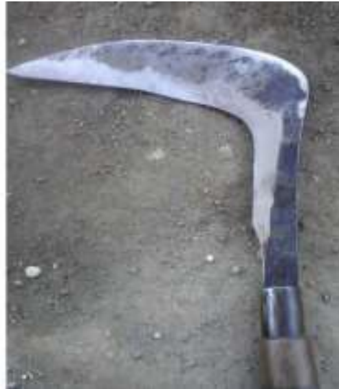
Gambar 5: Arit Sumber: Dok. Dian, Dhusun Ngangkruk 29 April 2018