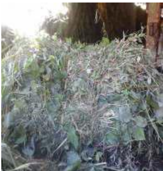
Gambar 45: Sabongkok