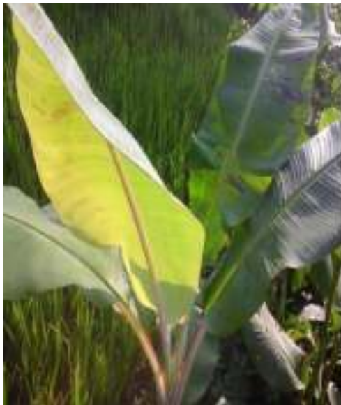
Gambar 34: Godhong Gedhang Sumber: Dok. Dian, Dhusun Ngangkruk 28 April 2018