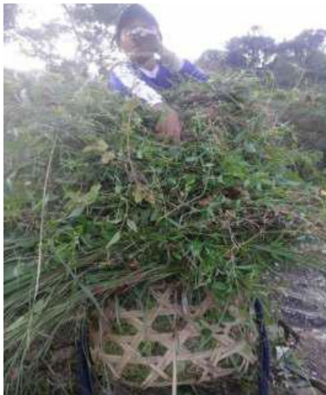
Gambar 37: Diumpang Sumber: Dok. Dian, Dhusun Ngangkruk 29 April 2018

Sumber: Dok. Dian, Dhusun Ngangkruk 29 April 2018