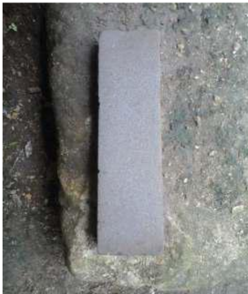
Gambar 8: Grenda