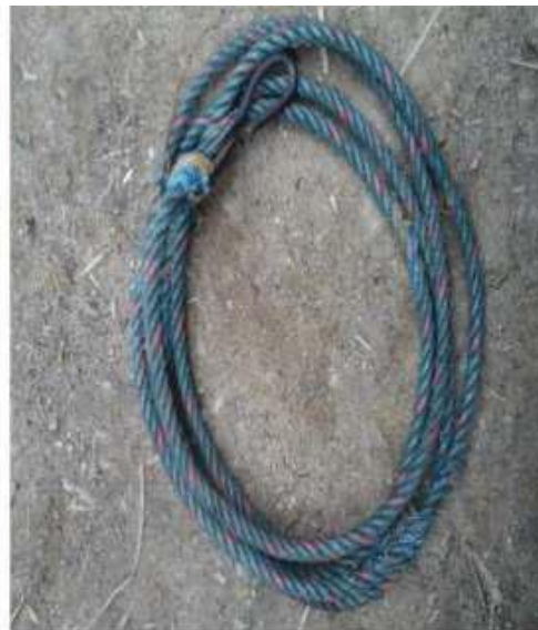
Gambar 9 : Tali Senar