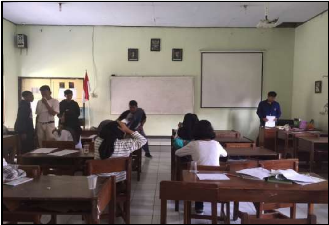
Peserta Didik Ekstrakurikuler Non-Olahraga sedang Mengisi Angket