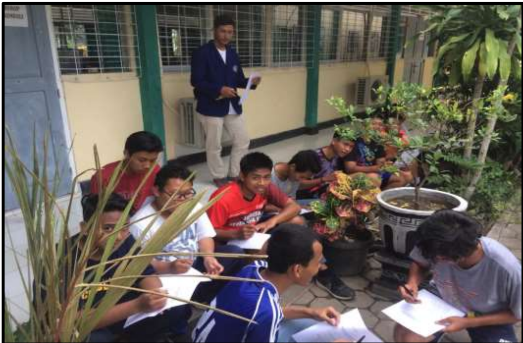
Peserta Didik yang Mengikuti Ekstrakurikuler Olahraga sedang Mengisi Angket