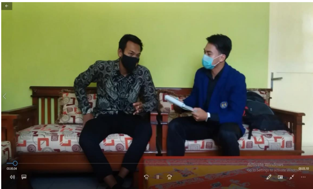
Gambar 4. Rekaman video Wawancara dan pengamatan di SMP Negeri 1 Saptosari