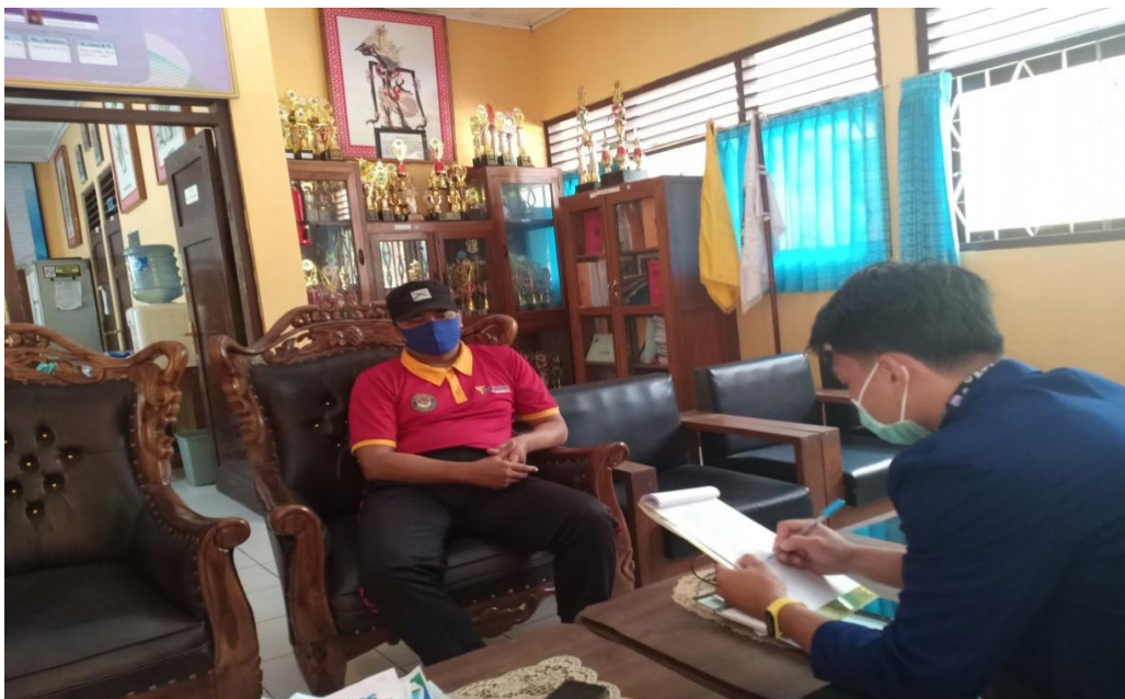
Gambar 2. Wawancara dan pengamatan di SMP Negeri 2 Saptosari