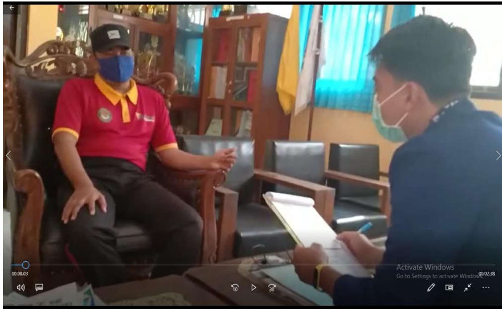
Gambar 5. Rekaman video Wawancara dan pengamatan di SMP Negeri 2 Saptosari