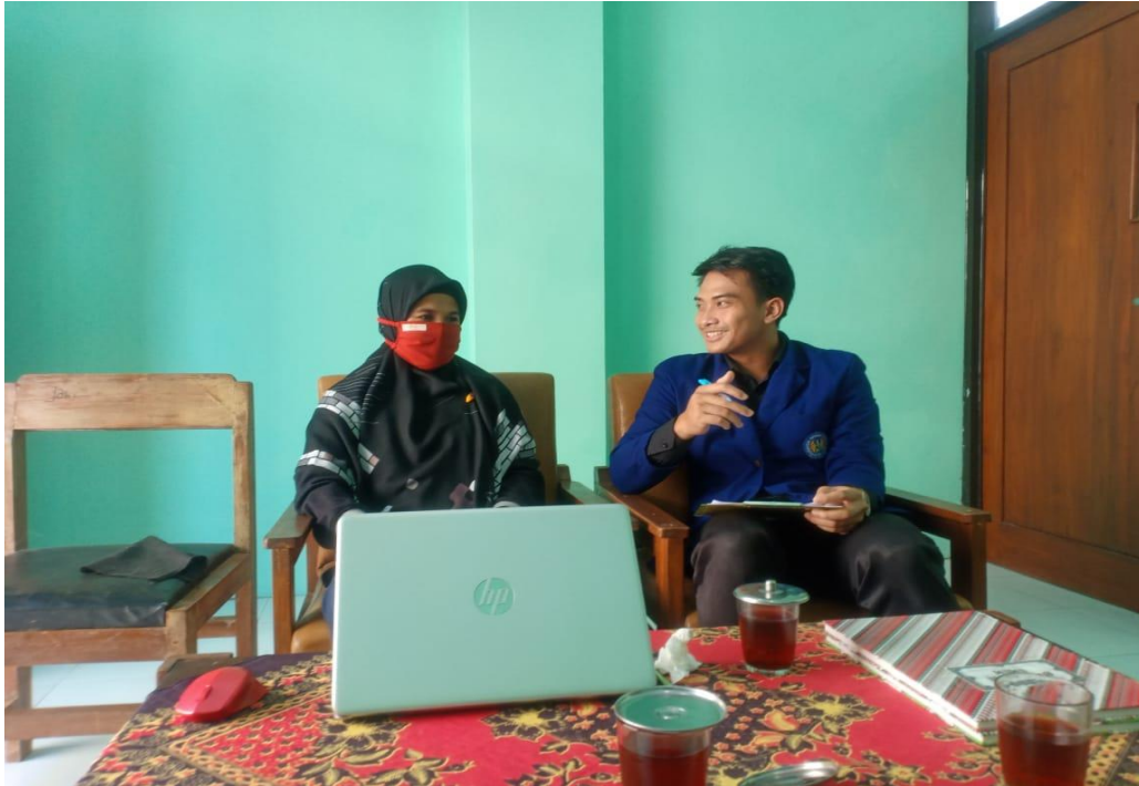
Gambar 3. Wawancara dan pengamatan di SMP Negeri 3 Saptosari