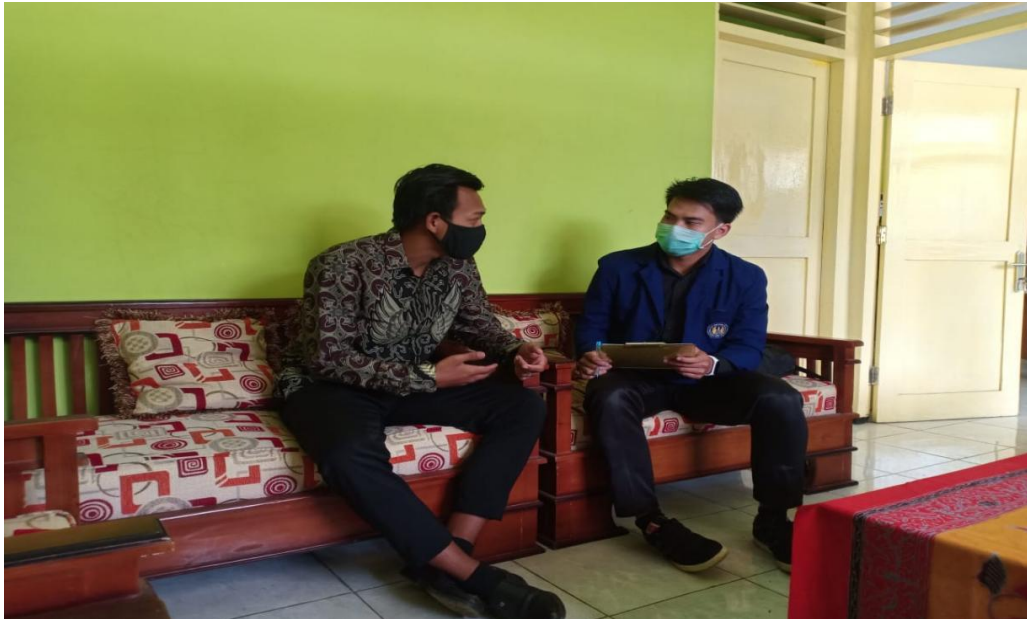
Gambar 1. Wawancara dan pengamatan di SMP Negeri 1 Saptosari