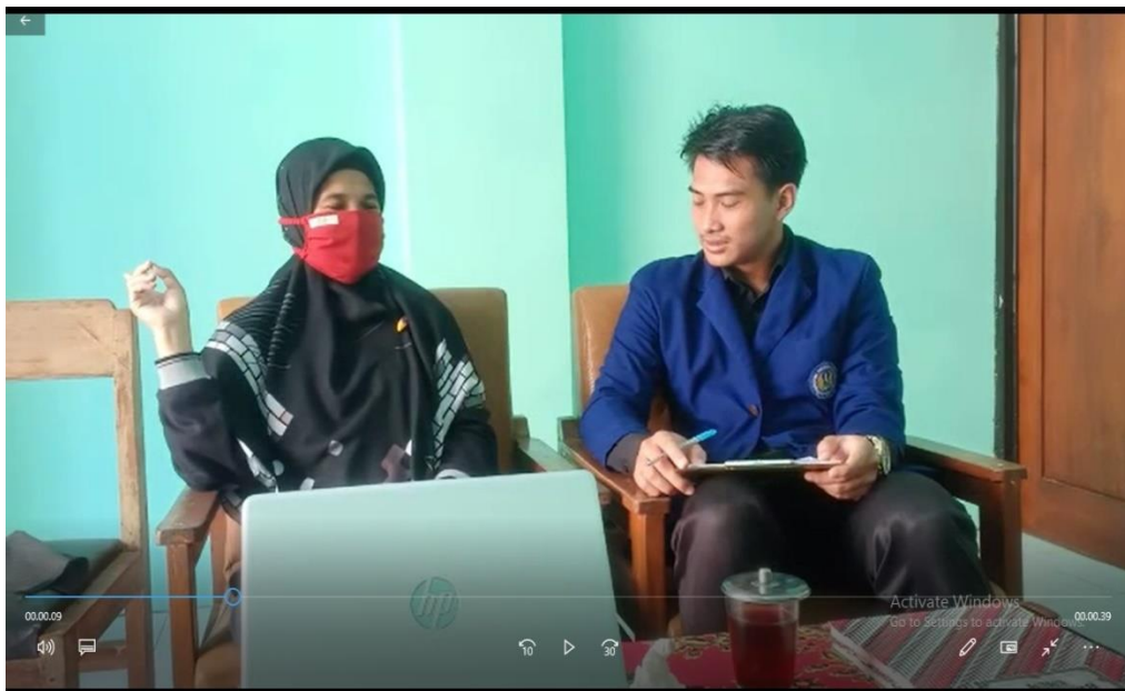
Gambar 6. Rekaman video Wawancara dan pengamatan di SMP Negeri 3 Saptosari