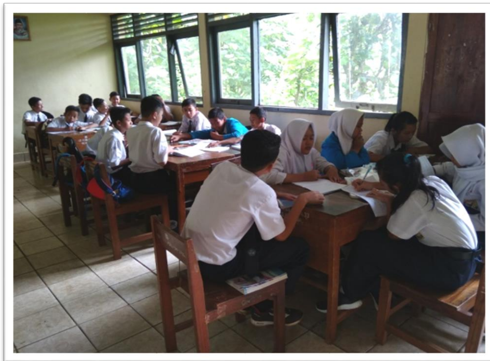
Foto 12. Kegiatan Literasi Sekolah