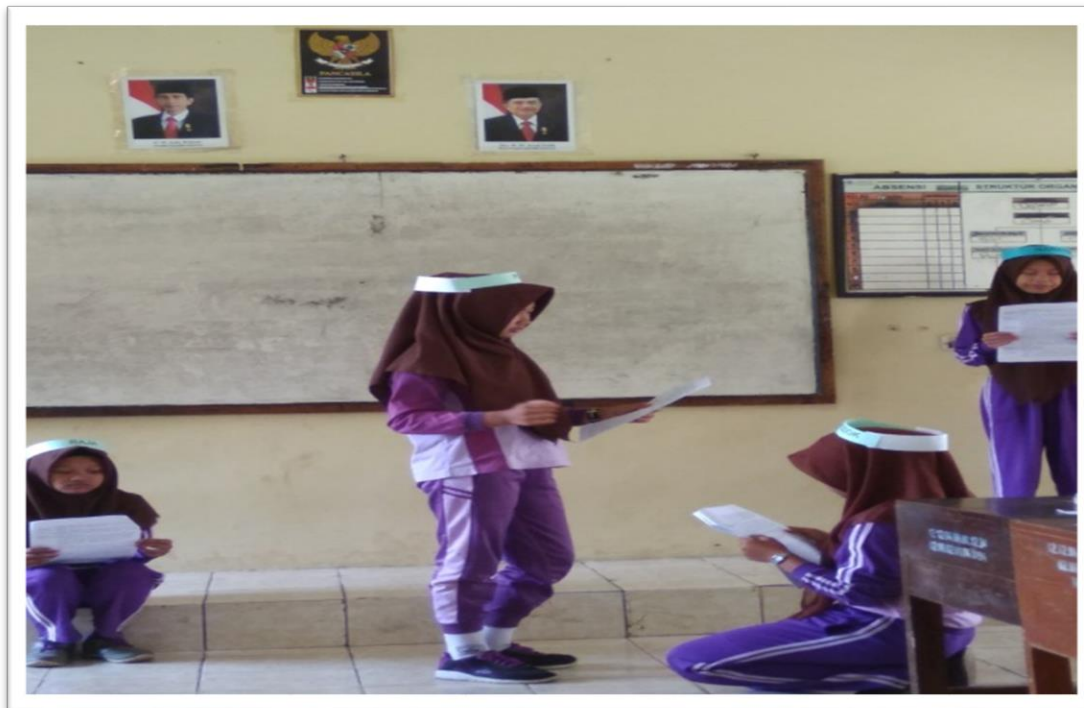
Foto 8. Pembelajaran Siklus 3