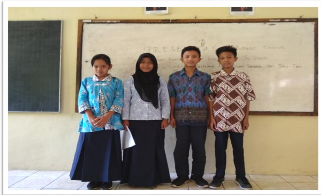
Foto 1. Kegiatan Prasiklus