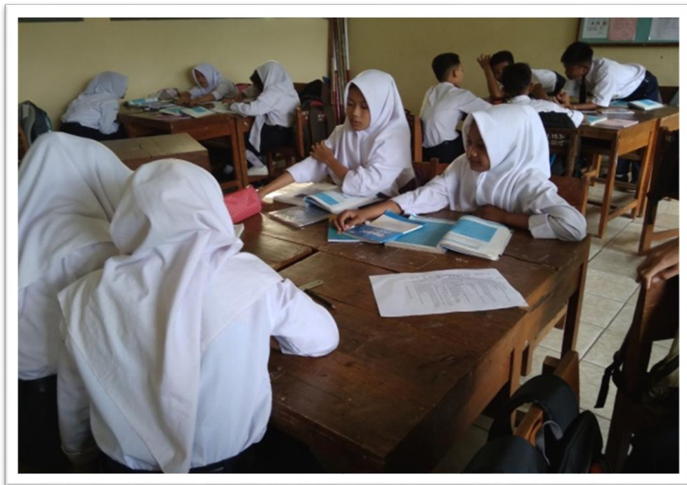
Foto 6. Pembelajaran Siklus 2