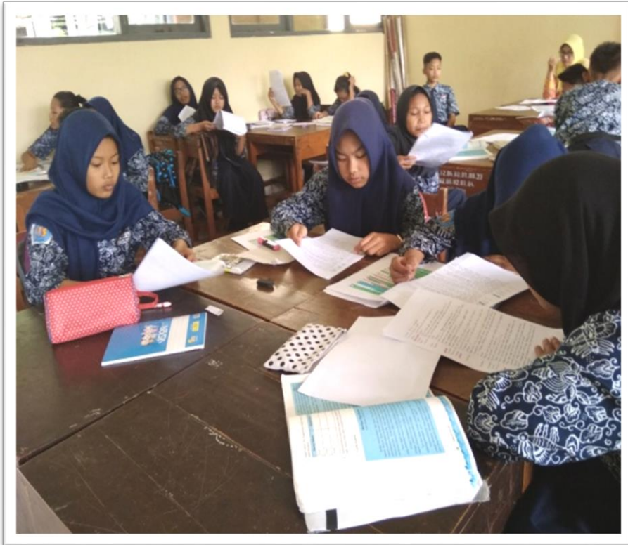
Foto 3. Pembelajaran Siklus 1