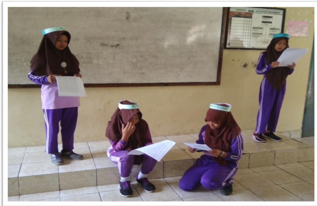
Foto 7. Pembelajaran Siklus 3