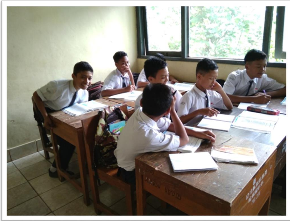
Foto 11. Kegiatan Literasi Sekolah