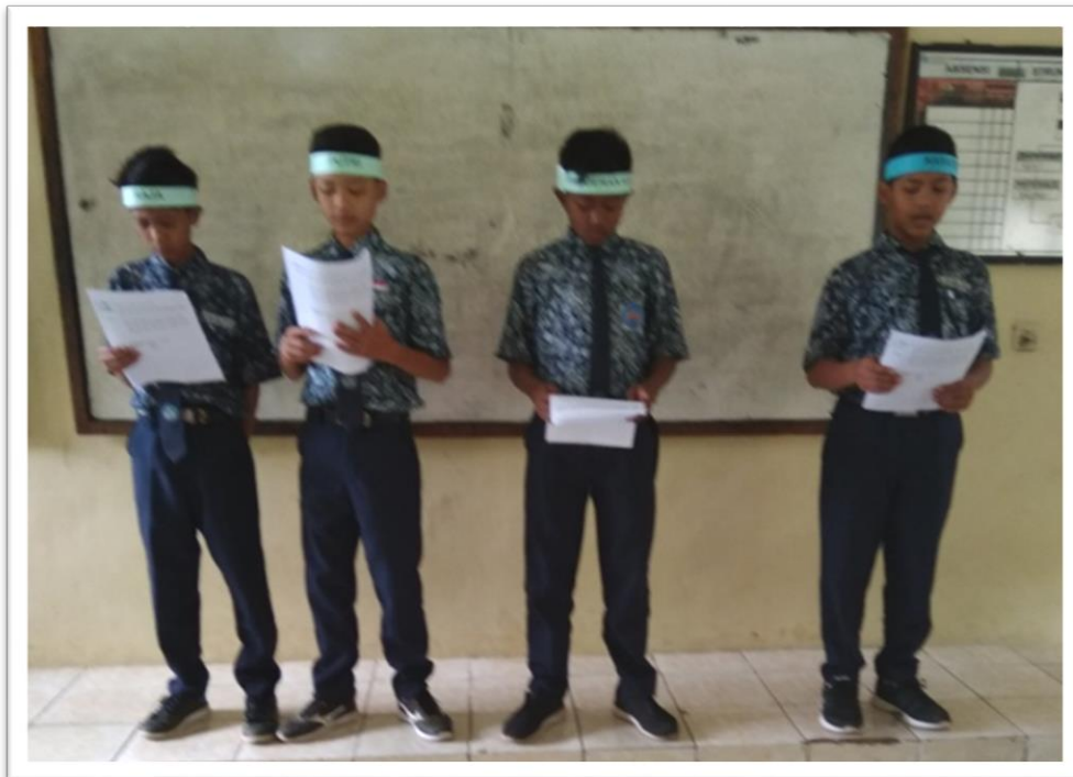
Foto 4. Pembelajaran Siklus 1