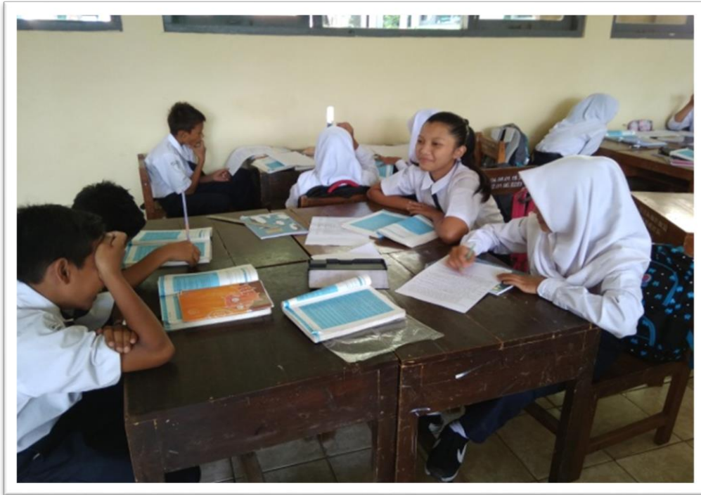
Foto 5. Pembelajaran Siklus 2