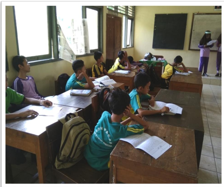
Foto 10. Pembelajaran Siklus 3