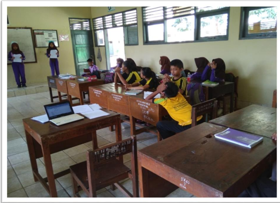
Foto 9. Pembelajaran Siklus 3