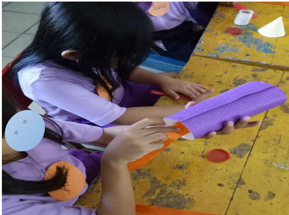
Gambar 2. Terlihat anak yang sedang fokus menyelesaikan tugas.