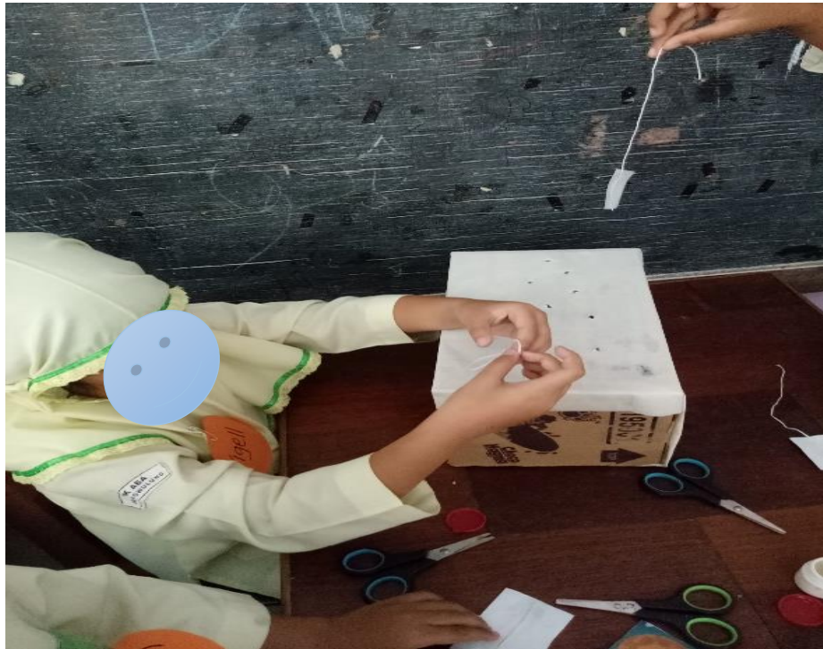
Gambar 1. Anak berkontribusi dalam kelompok pembuatan proyek system tata surya.