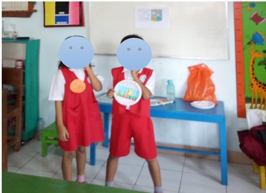
Gambar 4. Anak maju kedepan untuk menceritakan pengalamnannya dalam membuat produk.