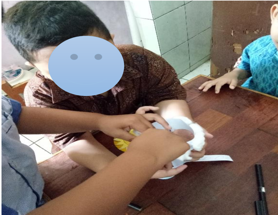
Gambar 3. Menunjukkan terdapat anak yang saling membantu teman dalam menyelesaikan tugas.