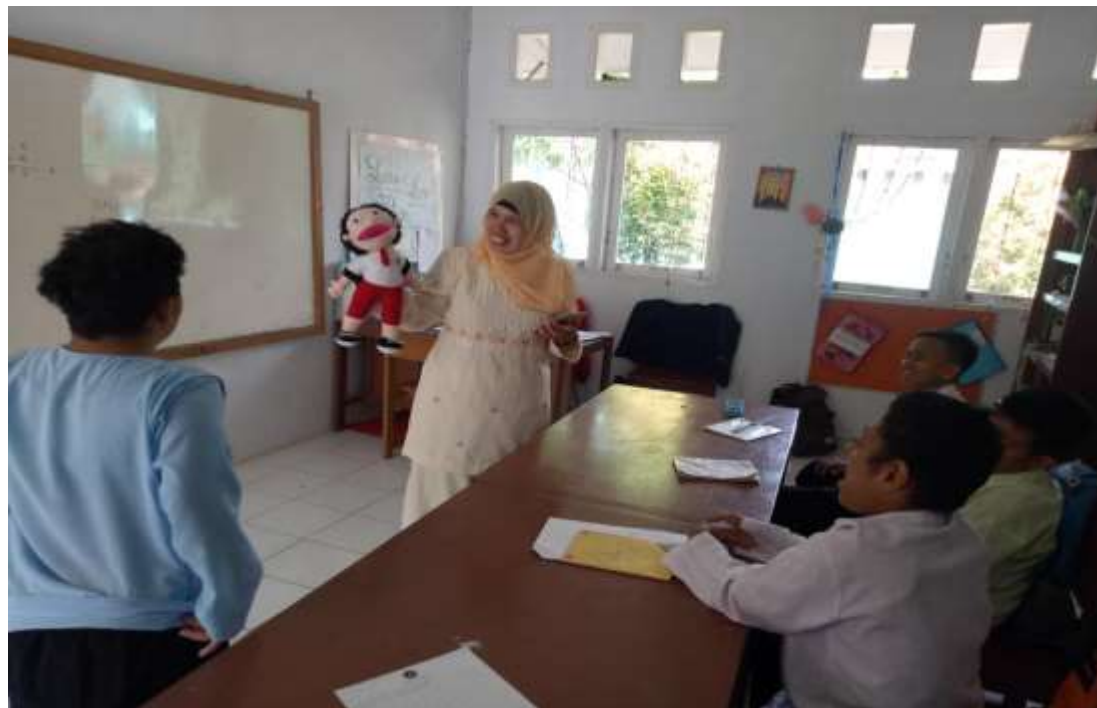
Pengisian angket oleh guru