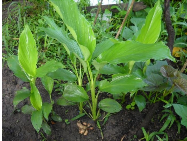
Gambar 2. Pohon Kunyit