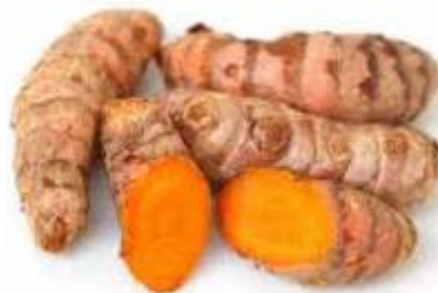
Gambar 3. Rimpang Kunyit