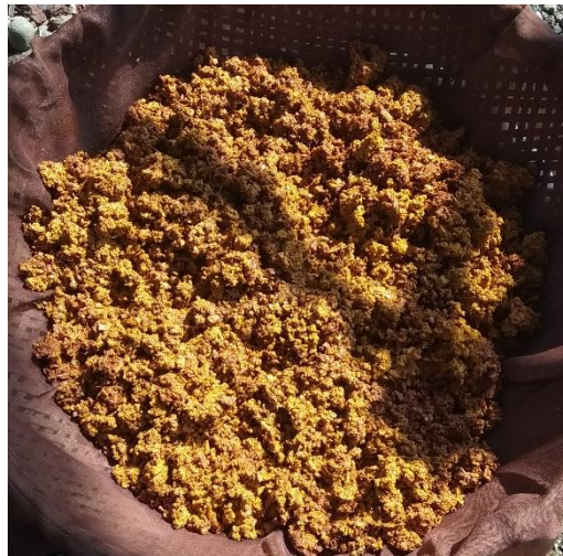
Gambar 4. Ampas kunyit

Untuk ampas kunyit hasil dari pembuatan jamu kunyit sendiri, pada penjual jamu tradisional maupun pada industri yang sudah modern, belum dimanfaatkan dengan baik. Biasanya hanya dibuang begitu saja, tanpa ada pengolahan lebih lanjut dari ampas kunyit tersebut, dan tentunya tidak memiliki nilai guna.