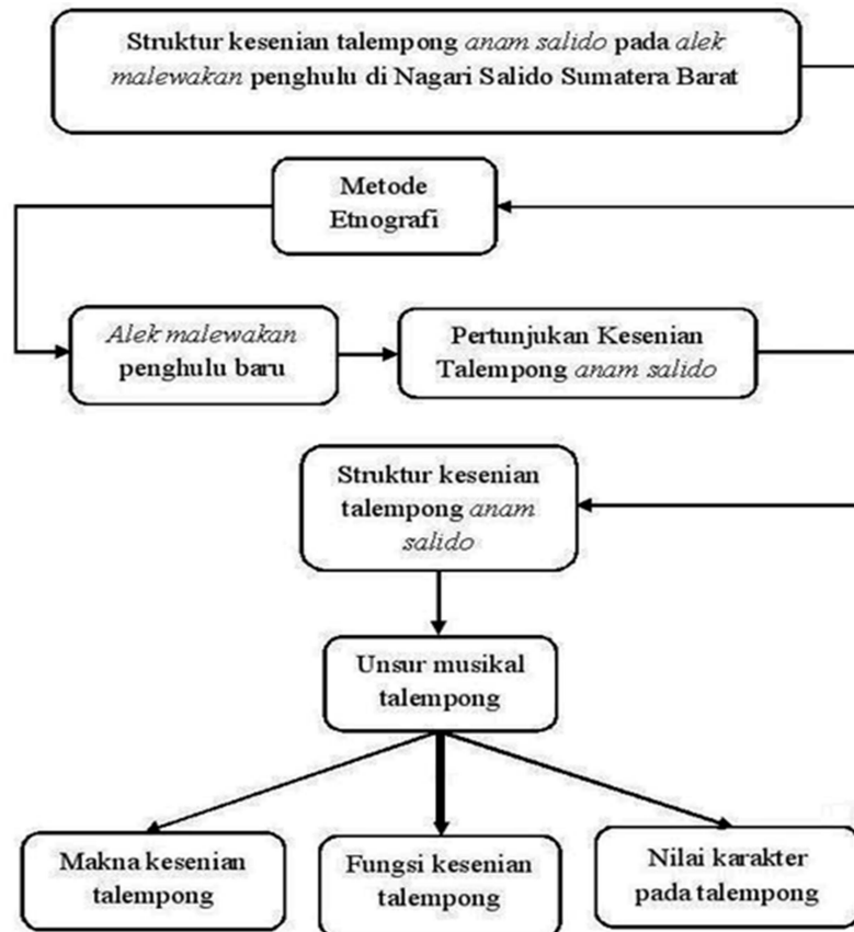
Gambar 2. Alur pikir penelitian