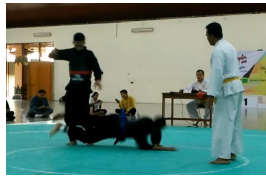
Gambar 1. Teknik Guntingan Dalam Sumber. Dokumentasi Pribadi