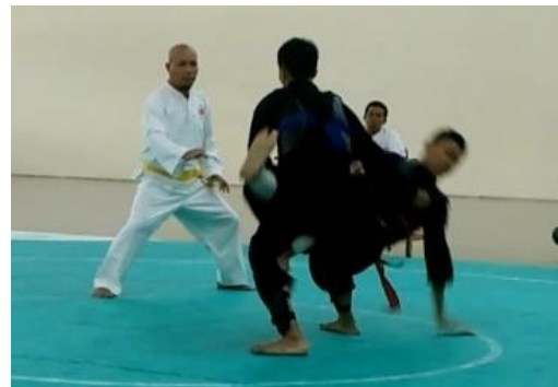
Gambar 2. Teknik Guntingan Luar

Berdasarkan uraian tersebut, maka untuk dapat melakukan keterampilan gerak teknik guntingan yang efektif dan efisien diperlukan kemampuan biomotor keseimbangan, kecepatan, ketepatan, kekuatan otot tungkai dan koordinasi yang baik antara mata, tangan dan kaki.