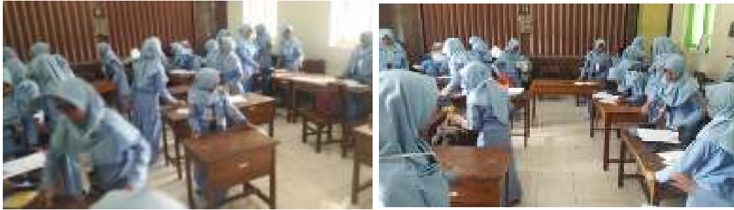
b. Penjelasan Penampilan PAIKEM Bernyanyi (11 September 2019)