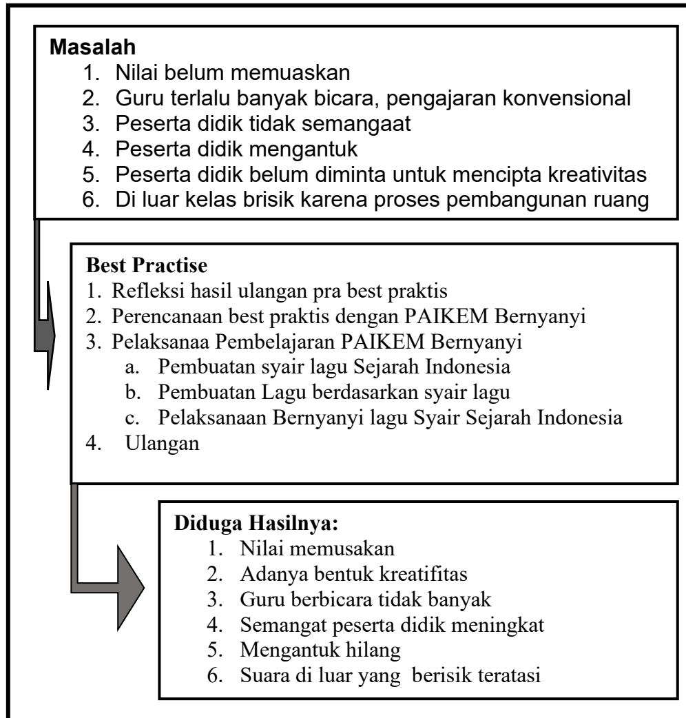
Denah 1: Alur Pemecahan Masalah dengan Best Practise